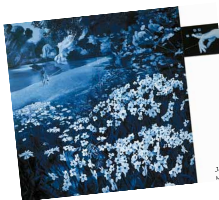
Jacques Monory: Velvet Jungle, 1971, Musée d'Art Moderne, Párizs

Csernus Tibor tradicionális értékekre reflektáló művészete a reneszánsz és a barokk tradíció formai karakterkészletét ötvözi saját korának vizuális jelenségeivel. Az 1970-es évektől kezdődő korszaka a „Figuration narratív” vagy „Nouvelle figuration” jelenséghez, főképp Jacques Monory vagy Gilles Aillaud művészetéhez, köthető. Míg azonban a fenti művészek inkább az amerikai pop-art, vagy hiperrealista irányzathoz kapcsolódtak, Csernus művészetében az európai festészeti tradíciók domináltak. Ebben az átmeneti időszakban a megszokott hiperrealista modorban készített művei mellett, lazább ecsetvonásokkal és lényegesen kevesebb illuzionista igénnyel festett képeket is készített. 1