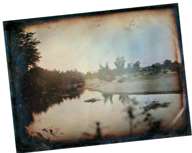
2. Dagerrotípiá, 1800-as évek közepe

Hatalmas szenzáció volt itthon, amikor a világ egyik legfontosabb kortárs művészeti intézményében, a Tate Modern-ben megnyílt Maurer Dóra pályáját bemutató kiállítás 2019-ben. Ezzel párhuzamosan London leghíresebb magángalériájában, a White Cube Bermondsey-ben is láthatóak voltak művei. Ilyen elismerésben eddig egyetlen magyar képzőművész sem részesült (italán Moholy-Nagy Lászlót leszámítva). Ennek következtében a „művészre és életművére, illetve ezenfelül a korszak magyarországi művészetére olyan széleskörű figyelem irányul, amely korábban elképzelhetetlen volt, és amelynek kétségkívül jelentős pozitív kihatásai lesznek” – írja Fehér Dávid. 1