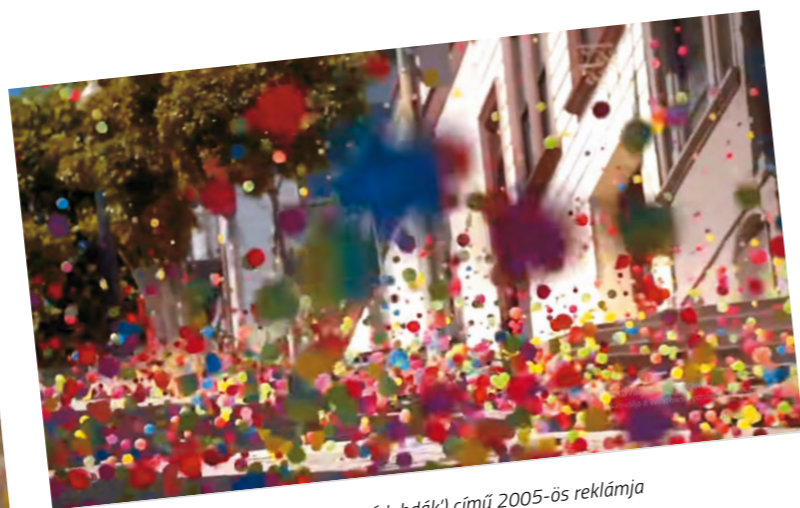
3. Sony Bravia Bouncy Balls ('Pattanó labdák') című 2005-ös reklámja