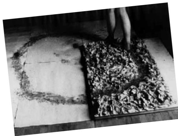
3. K.V. május 1-jei felvonulása mesterséges talajon , 1971 fotódokumentum-részlet

E jellegzetes műtípus magába sűrít több Maurer-féle gondolatot, problematikát: a mozgás és az idő fokozatos megtestesülését, fizikai relációjukat; egy vizuális jel létrehozását, eltüntetését, majd felülírását; a régi és az újabb jelentések bonyolult hálózatát; a destrukció mozzanatát, amely a „nyomhagyó” és a „lenyomat” viszonyában jut meghatározó szerephez; a kiinduló tárgy és a „végeredmény”, az esztétikai tárgy megkülönböztetését, amely az eredeti és a művi viszonyának érzékeltetésén és megváltozásán alapul.