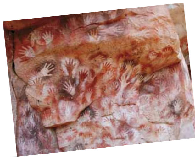
2. „A kezek barlangja”, Santa Cruz, Spanyolország, i.e. 550 körül

Maurer munkáiban hamar központi szerepet kapnak a nyomhagyás, a mozgás, az eltolódás és áttűnés jelenségei. Először a rézkarcokon kísérletezik a különféle anyagokkal és eljárásokkal, a nyomhagyás egyedi eseteivel (ld Pompeii-sorozat , 1966; Az este képei , 1966), majd innen továbbmegy, és figyelme nem pusztán a nyomatokra és az anyagszerűsége irányul, hanem magára a tárgyra, a nyomólemezre, amely a nyomrógzítést létrehozta, illetve a cselekvésre. 1970-ben már a konceptualizmus szellemében készülnek a megnyomódott, meggyűrt, áttört hordozó lemezről készült nyomatai, és az esemény fázisait rögzítő fotósorozatai (pl. Nagyon magasról leejtett lemez és nyomata , 1970). Kísérletezéseiből olyan új műfajok születnek, mint a folyamat- és akciógrafika vagy a pedotípiá. Ez utóbbi a lábnyomok nyomhagyásával alkotott egyedi nyomtat, melyeken a művész 1971-ben dolgozik. A pedotípiá-sorozatok során Maurer az ember által előállított jelképzés legősibb eszközét hívja életre. A lábnyom az „itt vagyok” húha-élményén túl (ld. barlangokban látható őskori kéz- és lábképek) a képi alkotás elemévé válik. Maurer egyik interjújában felidéz egy történetet, ami a Római fürdőnél esett meg vele: „a fürdő