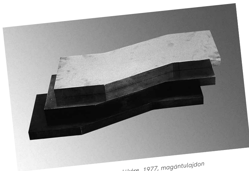
4. Nádler István: Apám emlékére , 1977, magántulajdon