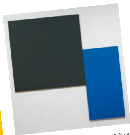
3. Ellsworth Kelly: Black Square with Blue , 1970 Tate Modern, London

„Az 1977-es Apám emlékére és Gyász című variációsorozatokon szín expanziójára épített képzeleti-szimbolikus tereket alkot Nádler. A képméreték és a képek alakjának változása is a kreatív viszonylatok kialakításához járul hozzá. A szín téralkotó, expanzív hatásával létrehozott képzeleti-szimbolikus terek művészi problémája némiképp rokon a hatvanas és korai hetvenes évek amerikai colour field (»színes mező«) festészetének problémakörével. 1 Hegyi Lóránd „színexpanzió”-nak nevezi, amikor egy nagy felületre nagy mennyiségben felvitt, felfokozott