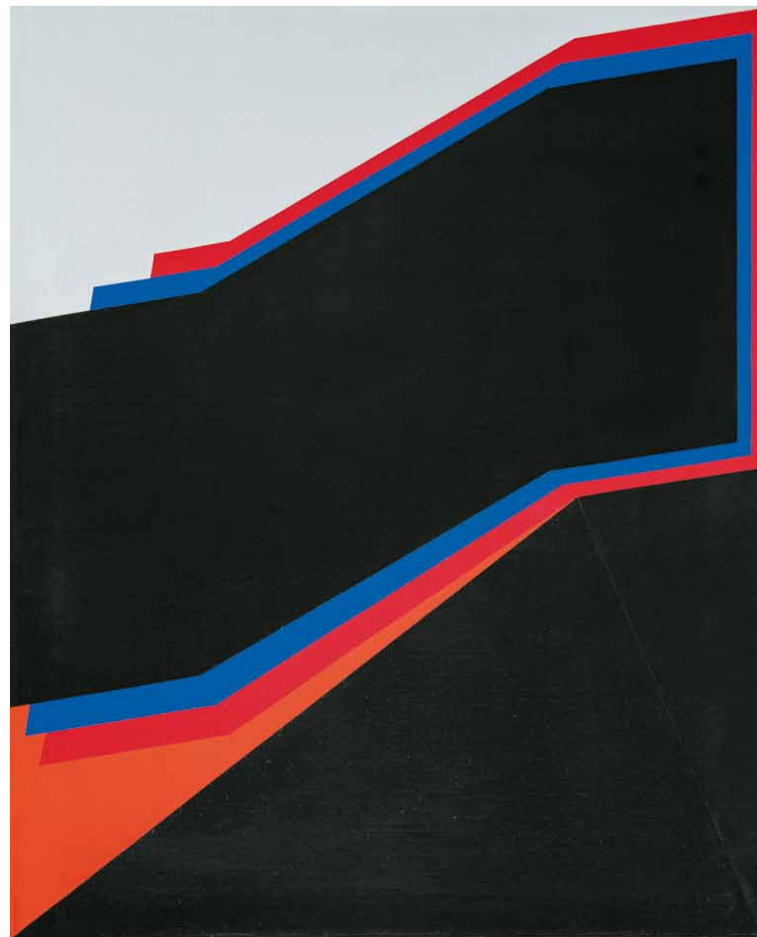
1. Nádler István: Gyász II., 1977 magántulajdon

új „humanizált”, érzelmi töltetű tér alakul ki. 2 Nádler 1977 és 1979 között három sorozatot készített ( Apám emlékére , Gyász I-IV. , Fehér képek ), amelyek különböző módon - édesapja halálára utalva - a gyász és a veszteség témáját dolgozzák fel. 1977-ben több kisebb-nagyobb méretű fémszobrot is készített ( Apám emlékére , 1977), melyek segítségével a plasztikus átló-motívumát jelenítette meg háromdimenziós térben. Nádler ezeket a diagonális, hajlított, kivágott fémlemezket egymásra helyezte, egyes szobrokat szórópisztollyal kékre, feketére vagy fehérre festette, olykor tükörfényesre polírozta. 3