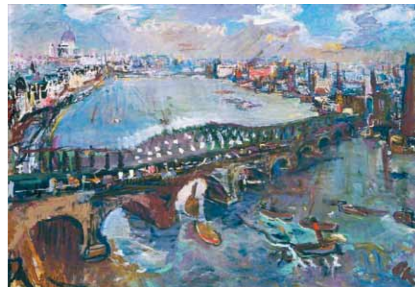
6. Oskar Kokoschka: Waterloo híd, London Walesi Nemzeti Múzeum, Cardiff