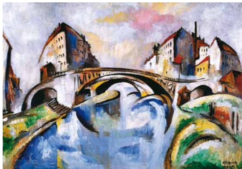
4. Kádár Béla: Hidas városkép, 1921 Szent István Király Múzeum, Székesfehérvár