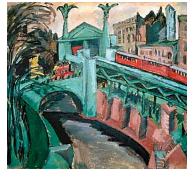
7. Ernst Ludwig Kirchner: Hallesches Tor, Berlin, 1911

A háború utáni években Scheiber mellett többek között Kádár Béla és Schönberger Armand is a nagyvárosi tematika felé fordult, a természeti motívumok helyett a nyüzsgő metropoliszok jellegzetes alakjait, színtereit keresték. A Múlt és Jövő című folyóirat 1921-es számában Scheibernek több rajza jelent meg, melyek szoros stílári és tematikus rokonságot mutatnak Kádár Béla szintén ekkor készült, ún. Bécsi map-