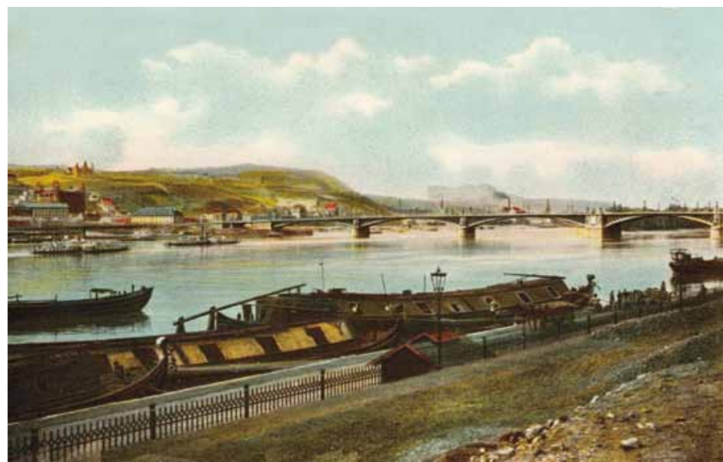
1. A Margit híd a pesti partról, 1909 postai levelezőlap