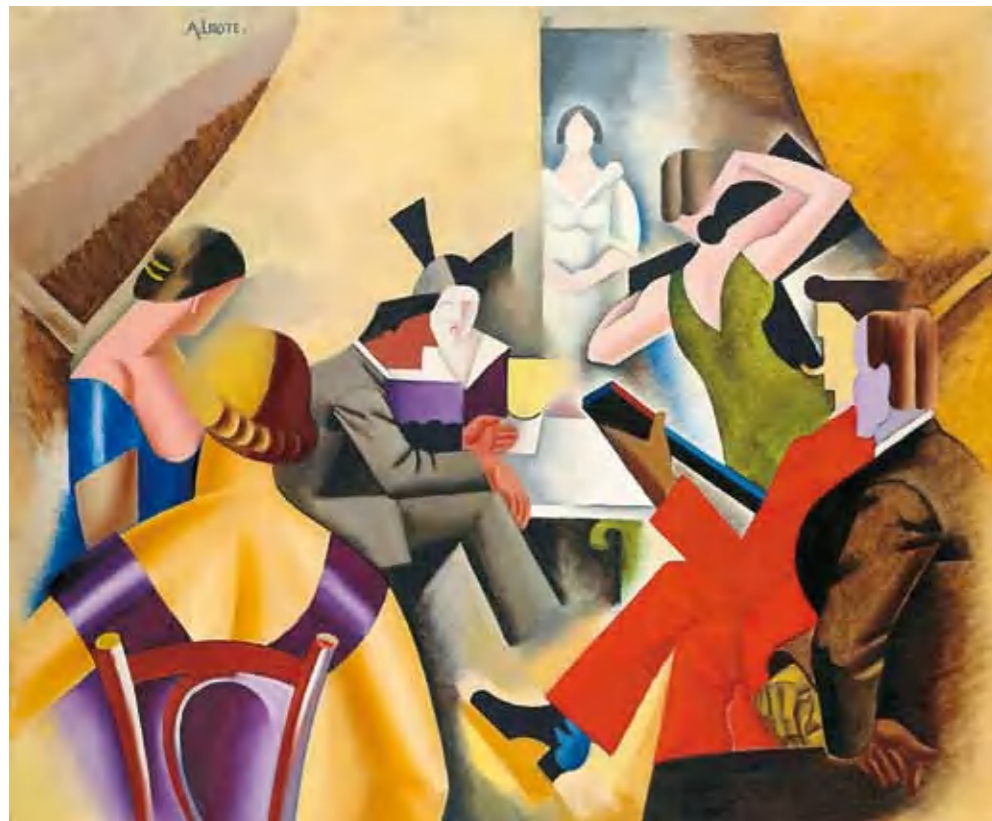
1. André Lhote: Tánc a bárban, 1920-as évek