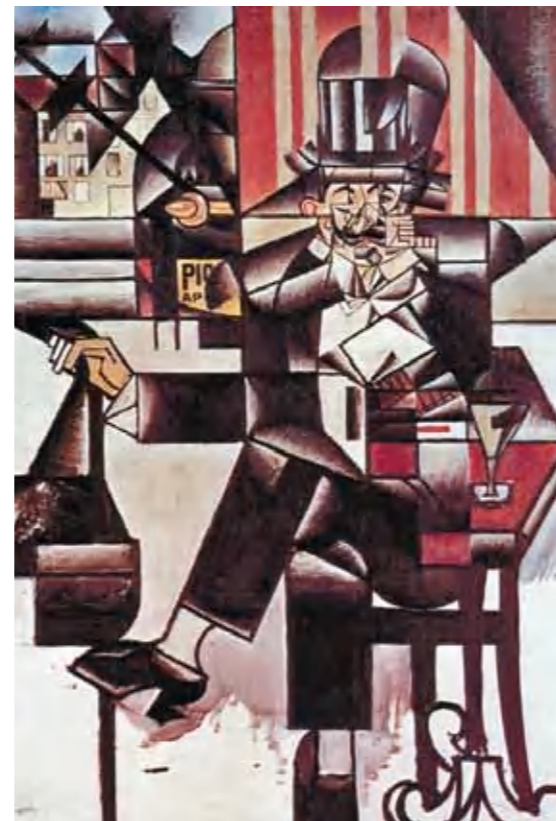
2. Juan Gris: Férfi kávéházban, 1912 Philadelphia Museum of Art, Philadelphia