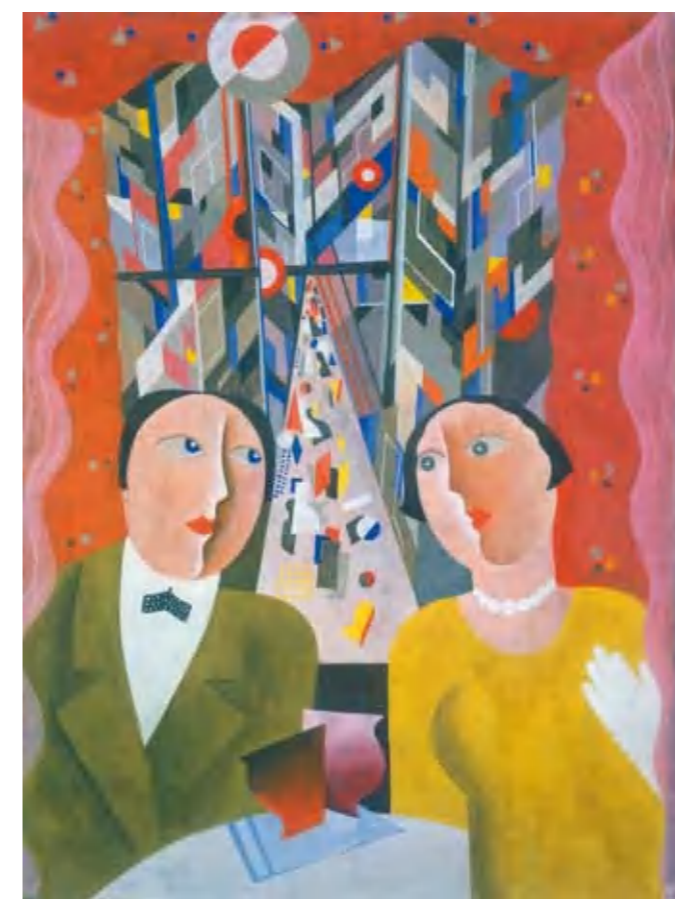
3. Kádár Béla: Kávéházban, 1927

„A festőnek, ha érzékenyen fogta fel a jelenségeket, rezonálnia kell a világ mozgalmasságára. Az őszinte megnyilatkozás kényszere készíteti munkára.” (Schönberger Armand)