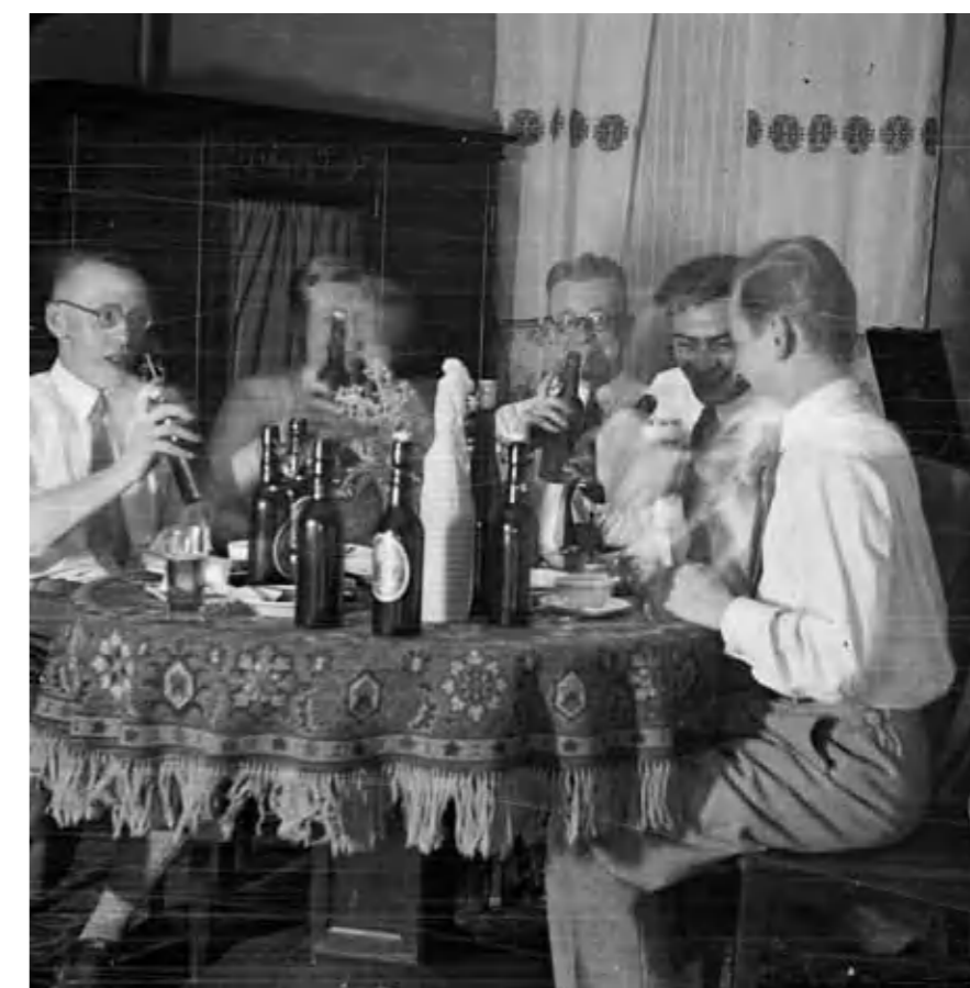
4. Italozás, 1924

képzőművészetek olyan szoros kapcsolatára, mint a két világháború közötti Európában és Amerikában. Míg azonban a 17-18. században ez csak a kevés kiválasztott számára volt elérhető, addig a 20. századi társasági szórakozás megannyi formája már bárki számára nyitott lehetőséggé vált. A kávéház, a lokál, a kabaré, a varieté, a revü, a cirkusz és vadonatúj médium közvetítőjeként a filmszínház a társasági élet addig ismeretlenül szabad és demokratikus színtereivé váltak.