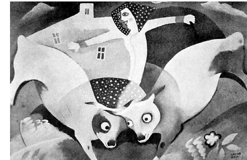
4. Kádár Béla: Jelenet tehennel, 1923. Reprodukálva a Periszkóp magazin 1925-ös számában.

mű számos izgalmas darabja külföldön talált vevőre, amelyek csupán az elmúlt években – gyakran hosszas kutatómunka után – bukkantak fel hosszú évtizedes lappangás után. Kádár sikerének titka „egyszerre nosztalgikus és korszerű stílusában rejlik. A magyar folklór sematizált motívumait jól kódolható képi rendszerré alakítja, és úgy szól az érzelmekhez, hogy közben számol a modern látványhoz szokott közönség formaérzékelével” – írja a festő monográfusa, Gergely Mariann. 1922-1926 között készült ciklusának karakteres formavilágát Marc Chagall és Heinrich Campendonk képei inspirálták. Mesészerű képein a falusi élet szereplői és hétköznapi eseményei jelennek meg. A most aukcióra kerülő festmény két további változatban is ismert, fel-