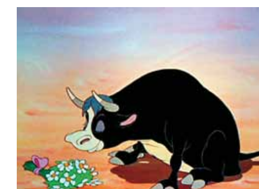
5. Ferdinánd, a bika. Walt Disney rajzfilmfigurája, 1937