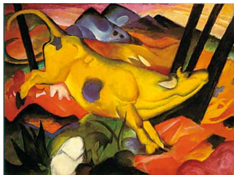
2. Franz Marc: A sárga tehén, 1922 Solomon R. Guggenheim Museum, New York