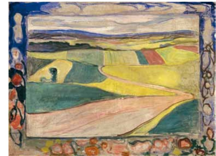
1. Vaszilij Kandinszkij: Táj nyáron, 1909 The Russian Museum, Szentpétervár