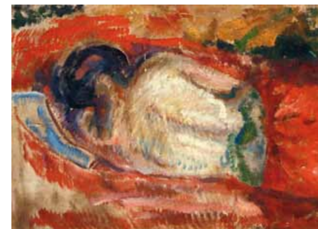
5. Edward Munch: Hátakt, 1917-19 Munch Museum, Oslo