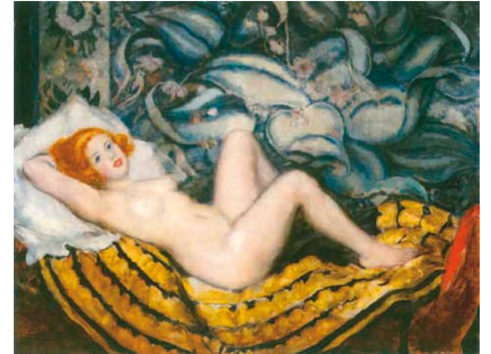
4. Csók István: Rossz az, aki rosszra gondol, 1925 Magyar Nemzeti Galéria, Budapest

torzításai miatt. Ugyanakkor – néhány háborús és biblikus kép kivételével – ezek a művek nem borúsak: aktok, csendéletek, portrék, amelyeken a fekete feladata, hogy a többi szín mélységeit jobban kiadja.