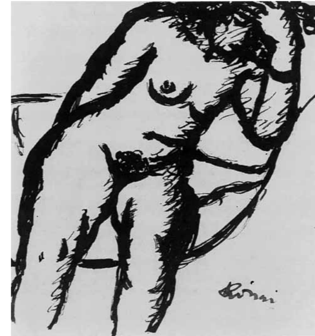
3. Rippl-Rónai József: Akt, 1910-1911 Magyar Nemzeti Galéria, Budapest