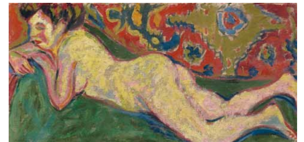
6. Ernst Ludwig Kirchner: Fekvő akt, 1909 The Museum of Fine Arts, Boston