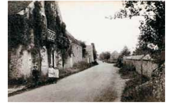
3-5. Grosrouvre a 20. század elején (képeslap)

Czóbel Béla különböző korszakainak nevét jellemzően azokról a nagyvárosokról, helységekről kapta, ahol épp tartózkodott. Így beszélhetünk párizsi, hollandiai, berlini vagy akár szentendrei periódusairól. Ezeknél természetesen nemcsak a helyszín és az időpont más, hanem jellemzően művészete is megváltozott. Az ún. második párizsi időszak 1925-től a világháború kitöréséig tartott, amikor is Czóbel 1914 után immáron másodszer kényszerült arra, hogy választott otthonát elhagyja.