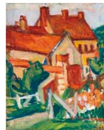
6. Czóbel Béla: Sárga házak, piros tetők (Tájkép, Gros Rouvre-i házak), 1927 magántulajdon