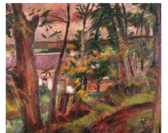
8. Henri Le Fauconnier: Liget Gros Rouvre mellett, 1946 magántulajdon