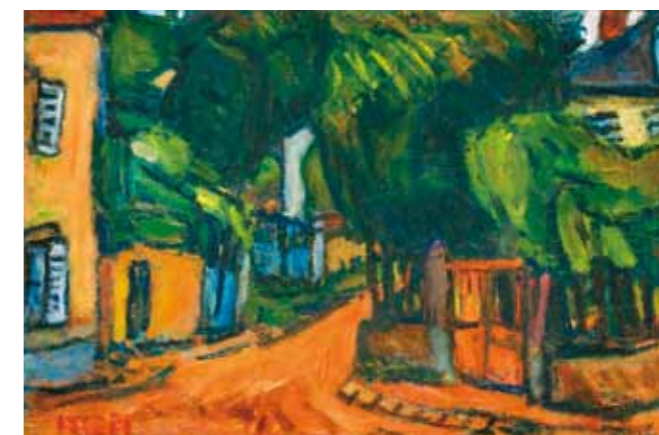
7. Czóbel Béla: Gros Rouvre, 1926 magántulajdon