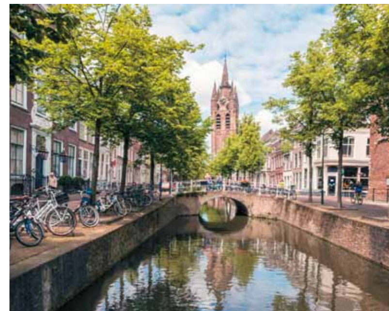
5. Delfti kanális