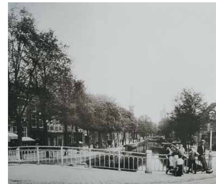
6. Delft, 1900-1905