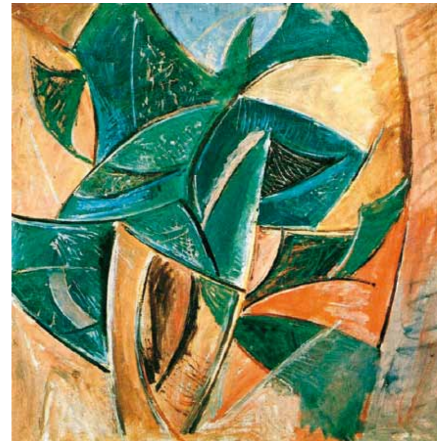
1. Pablo Picasso: Fa, 1907 Picasso Museum, Párizs