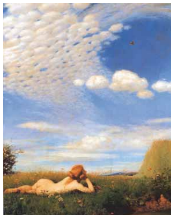
7. Szinyei Merse Pál: A pacsirta, 1882 Magyar Nemzeti Galéria, Budapest