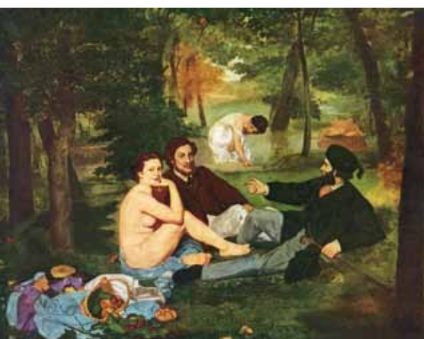
8. Edouard Manet: Reggeli a szabadban, 1863 Louvre, Párizs

Az újrakezdés éveiben friss, oldott tájképei mellett – Pipacsos mező, 1896, Falu alatt, 1897, Reggel, 1900 – figurális témák is foglalkoztatták Szinyeit. A felszabadult tájfestés – mellyel sikert-sikerre halmozott a budapesti kiállításokon – nem elégítette ki újra fellángoló művészi ambícióit. Eltökélttségének egyik hajtóereje volt, hogy legfőbb sérelme a Majális 1873-as bukása után közel 20 évvel végre elégtételt vett a müncheni közönségen. Az 1901-es nemzetközi kiállításon – a régi csalódás színhelyén – átütő sikert aratott az újra beküldött képpel. A zsűri nagy arannyal tüntette ki az alkotást, ami kellő módon kárpótolta a mestert minden addig elszenvedett sérelméért. Sőt a siker magabiztos-