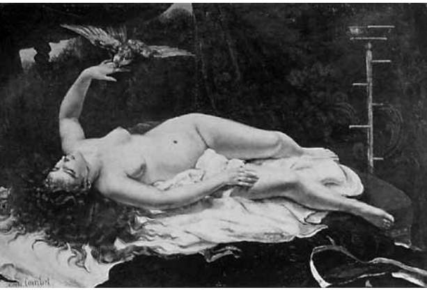
1. Julien Vallou de Villeneuve: Fekvő akt, 1860 körül Metropolitan Museum of Art, New York