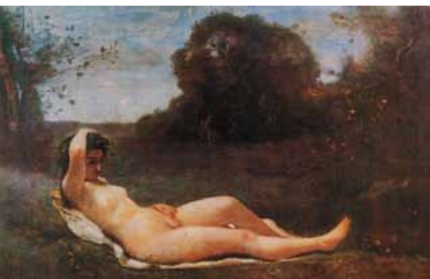
3. Camille Corot: Fekvő nimfa, 1859 Musée d'Art d'Histoire, Genf