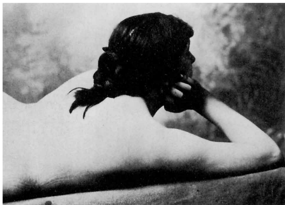
6. Fotótanulmány A pacsirtához, 1882 körül

Forrás: Végvári Lajos: Szinyei Merse Pál 1845-1920, Képzőművészeti Kiadó, 1986, 71-72. oldal