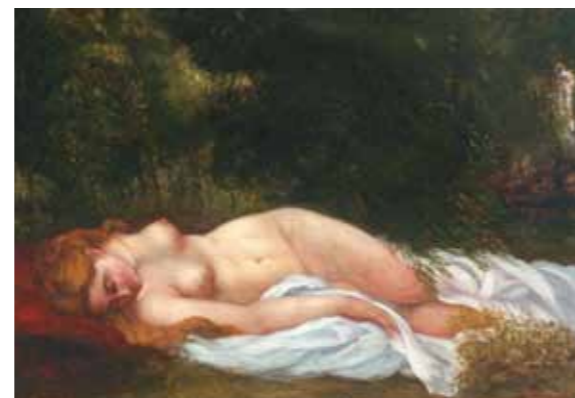
5. Gustave Courbet: Fekvő akt, 1866 magántulajdon