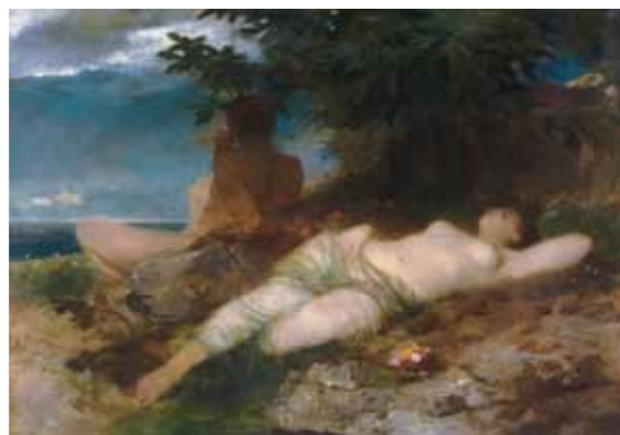
4. Arnold Böcklin: Nimfa és Szatír, 1871 Philadelphia Museum of Art, Philadelphia