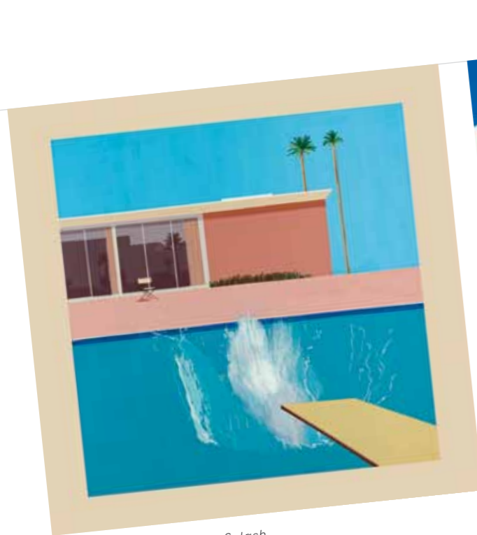
1. David Hockney: A Big Splash („Egy nagy csobbanás”), 1967, Tate, London