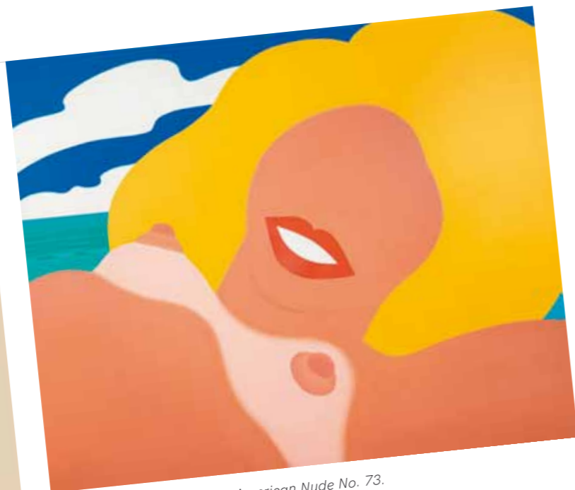
2. Tom Wesselman: Great American Nude No. 73 („Nagy amerikai akt Nr. 73”), 1965, magántulajdon

segítették a pop art elterjedését. Egyrészt közvetlenül reagáltak az amerikai és angol pop art-ra, másrészt az úgynevezett szocialista kultúrára is. Lényeges különbség, hogy a kelet-európai művészek nem piacra, nagyon eltérő művészeti rendszerben, információs körülmények között dolgoztak, más stratégiák vezérelték őket. Vannak, akik szerint nálunk csak egészen rövid ideig tartott a virágzása (és elsősorban az Iparterv nemzedék munkásságában jelent meg eltérő hangsúllyal), míg mások szerint a pop art jegyei spóraszerűen elszórták, és beépültek a művészetünkbe. Keserű Katalin a magyar pop art két nagyobb hullámát különbözteti meg: az első a hatvanas évek derekától az évtized végéig tartott, a másodvirágzása pedig a hetvenes-nyolcvanas években volt. Utóbbi hullámból nőtt ki az új dadaista művészet, amely a valósághoz ugyancsak szorosan kötődött, s annak elemeit nem művészi eszközökkel használta fel. 1 ef. Zámbo – konkrét kategóriáknak, irányzatoknak és műfajoknak ellenálló – művészet jobbján a szürrealista, dadaista