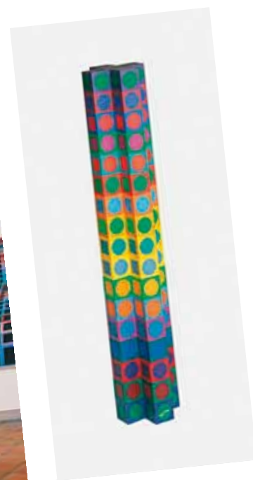
2. Victor Vasarely: Iboya MC12, 1970 magántulajdon