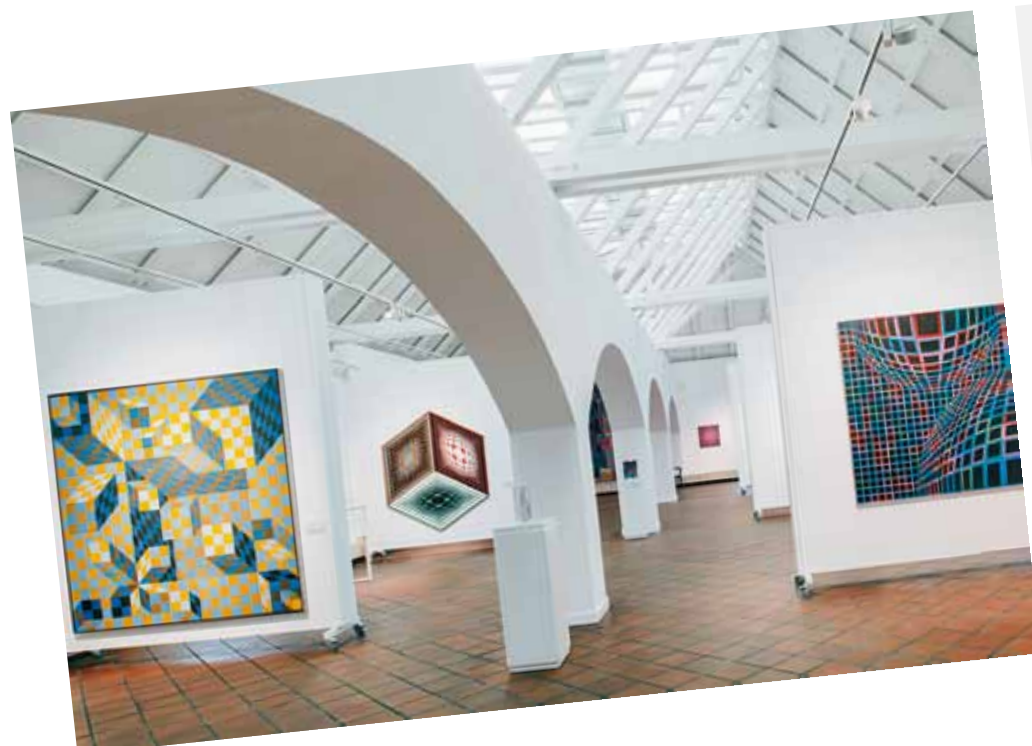
1. Az állandó kiállítás enteriőr-fotója a Szépművészeti Múzeum - Vasarely Múzeumban, Budapest