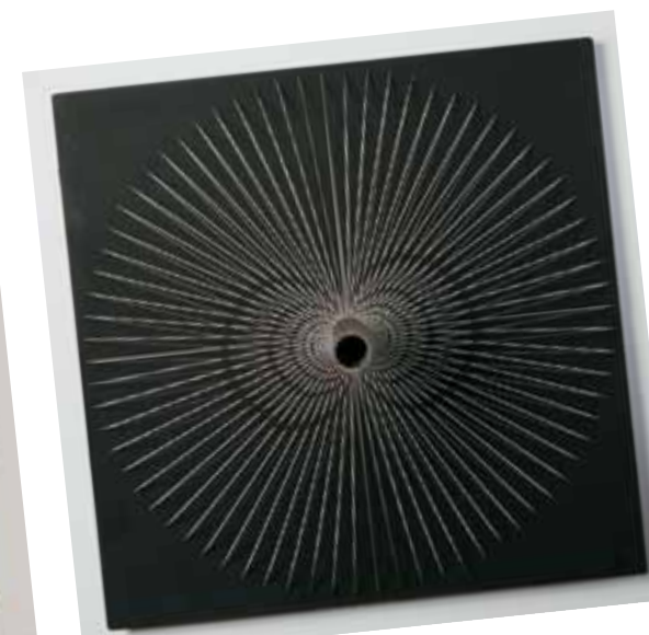
4. Yvaral: Interference , 1966, ZKM - Center for Art and Media Karlsruhe

Az „op-art”, vagyis az optikai művészet pápájaként számontartott Victor Vasarely pályája Magyarországon indult, 1906-ban született Pécsen, Vásárhelyi Győző néven. 1929-1930 között tanulmányokat folytatott a Bauhaus alapokra épülő reklámgrafikai iskolában, Bortnyik Sándor Műhely ében, amit mindvégig döntő fontosságúnak tekintett a pályáján. Vasarely 1930-ban érkezett meg Párizsba, ahol azonnal el tudott helyezkedni a reklámszakmában, megbízást kapott több kiadótól, köztük az Agence Havastól, valamint a Draeger és Devambez nyomdaktól. Legkorábbi grafikai tervein felismerhetők még azok a sikeres reklámötletek, amelyeket Budapestről hozott, de munkáit rövidesen nem Vásárhelyi Győzőként, hanem Victor Vasarelyként írja alá. 1939-ben megismerkedett Denise Renével (Denise Bleibtreu, 1913-2012), akit