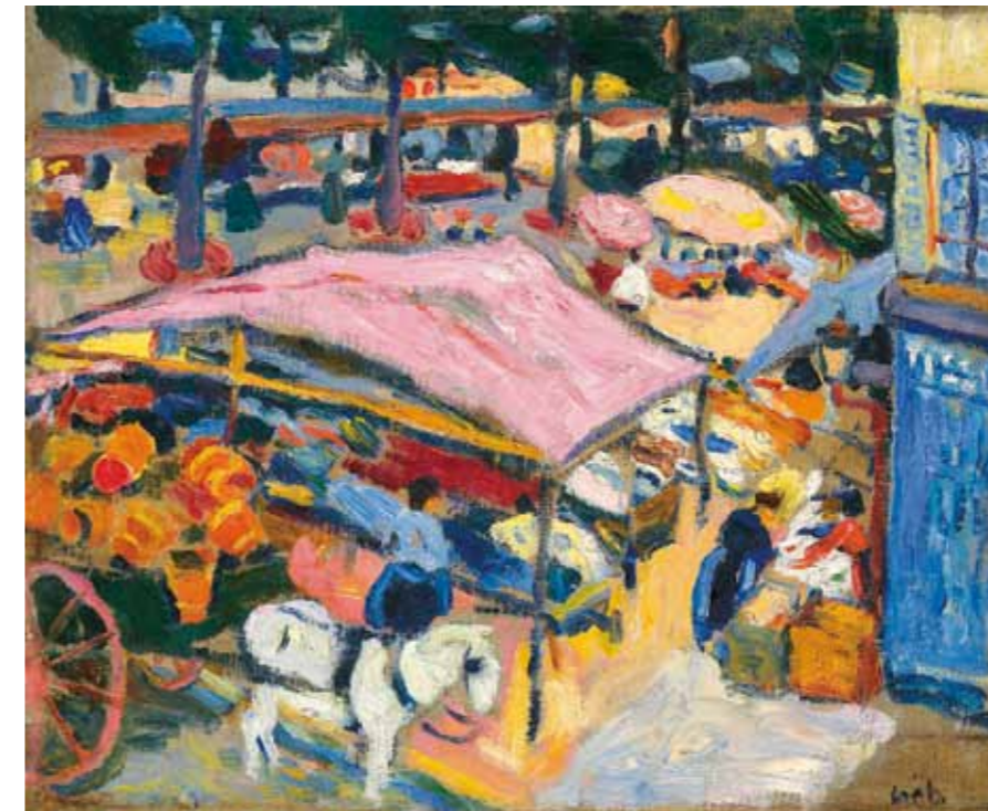
9. Czöbel Béla: A piac sarka (Bon Coin), 1905

képet, a legvalószínűbb, hogy a rue Vaugirard-i műteremlakásához közel eső Luxembourg-kertben, ahova rendszeresen eljárt krokizgatni, festegetni, s ahol több körhinta várta a parkba ellátogató gyermekeket. Párizs szerte ma is igen népszerűek a több mint egy évszázada mit sem változó körhinták, s közülük a legidősebb (141 éves) éppen a Luxembourg-kert közepén üzemel napjainkban is. Az azonosítást egyértelművé tehetné, ha a „Karussell” forgatagában feltűnne „egy bőszi piros oroszlán”, vagy éppen „egy fehér elefánt”, ahogy alig két évvel később az akkor éppen szintén a közelben, Czöbel fiatal magyar kollégájával, Berény Róberttel egy házban lakó Rainer Marie Rilke is megénekelte Karussell, Jardin du Luxembourg című költeményében. A kép címét már minden bizonnyal a nagybányai