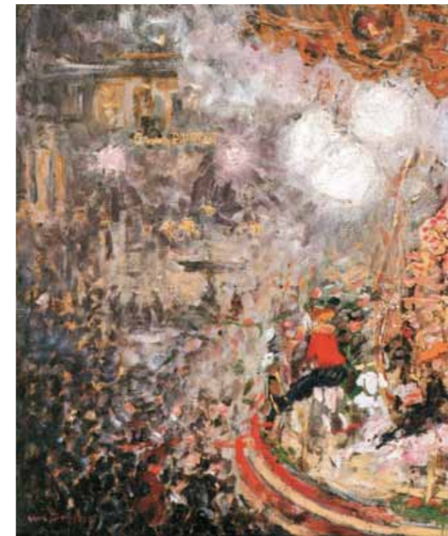
5. Kees van Dongen: Körhinta a Place Pigalle-on, 1904, magántulajdon