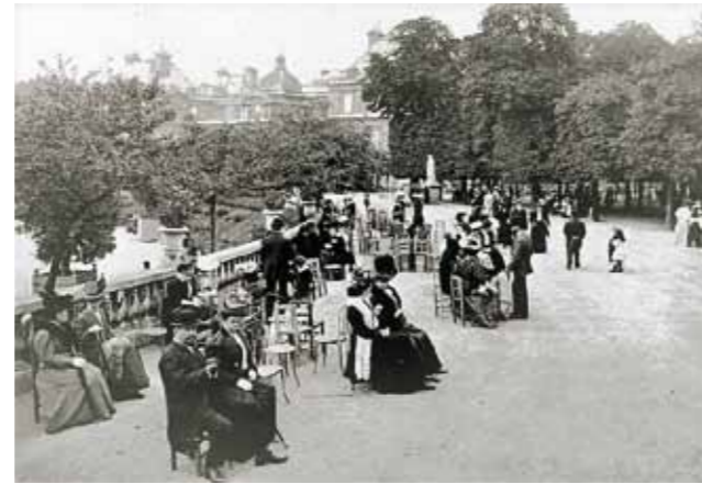
4. Luxembourg-kert, Párizs, 1900