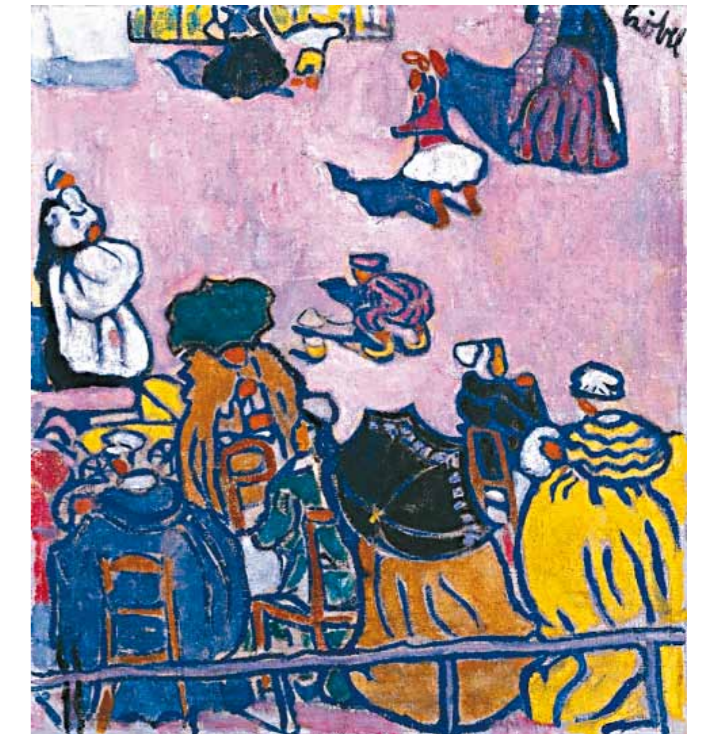
10. Czöbel Béla: Téren, 1905-1906, magántulajdon