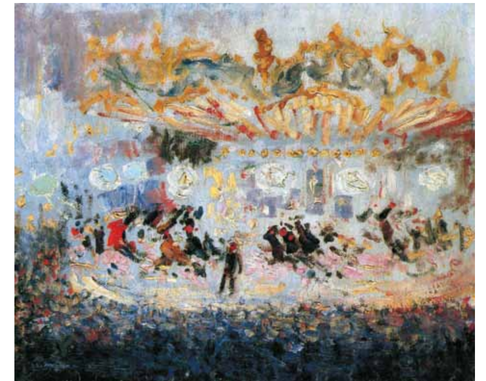
6. Kees van Dongen: Le carrousel, 1904