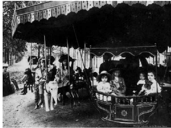
2. Körhinta a fehér elefánttal a Luxembourg-kertben