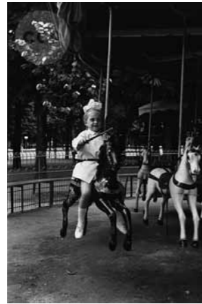
3. Körhinta Párizsban