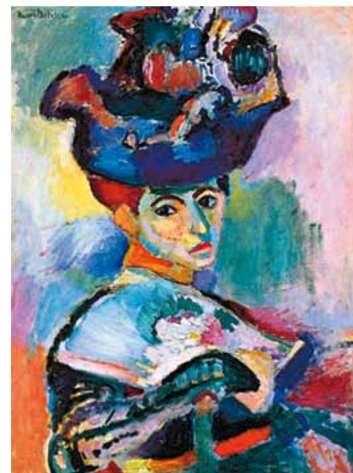
2. Henri Matisse: Kalapos nő, 1905 San Francisco Museum of Modern Art (SFMOMA), San Francisco, USA