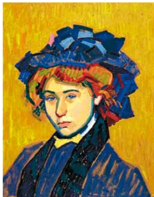
1. Auguste Herbin: Egy fiatal lány portréja, 1907 magántulajdon