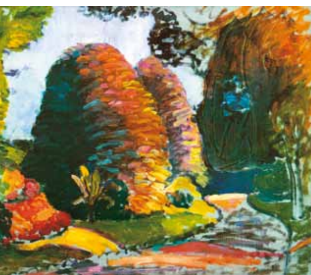
1. Henri Matisse: Luxembourg sert, 1902-1903