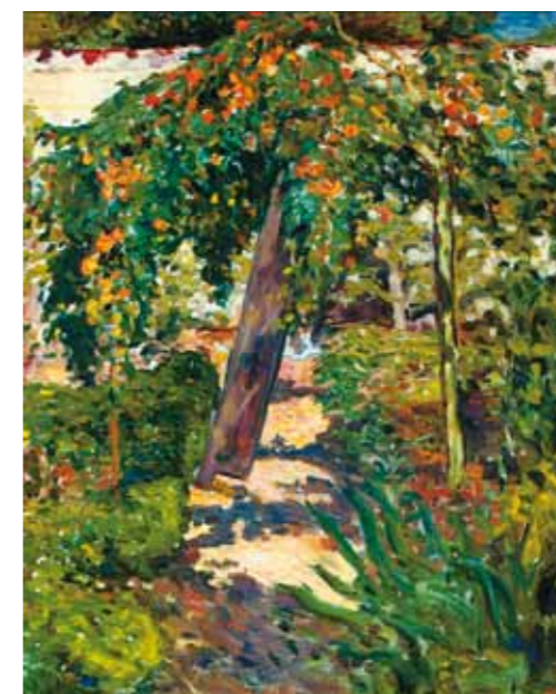
2. Louis Valtat: Fa a kertben, 1896

látványtól, egy a természetben ritkán előforduló színhez hangolhassák képeiket, s ezzel az addigiaktól gyökeresen eltérő, modern, a naturalizmustól emelkedő műveket hozzanak létre.