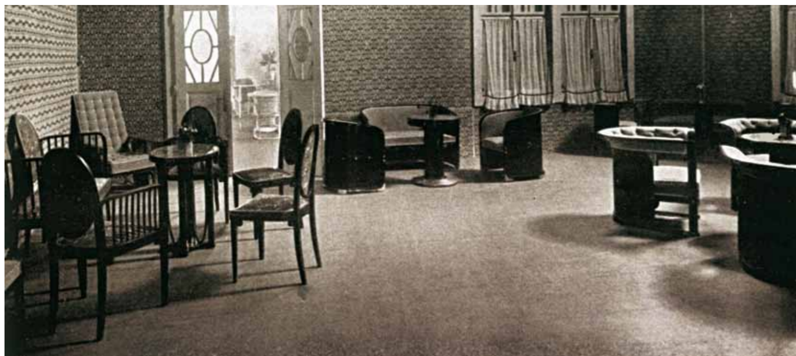
2. Szobabelső Josef Hoffmann és Jacob & Josef Kohn által kivitelezett bútorokkal