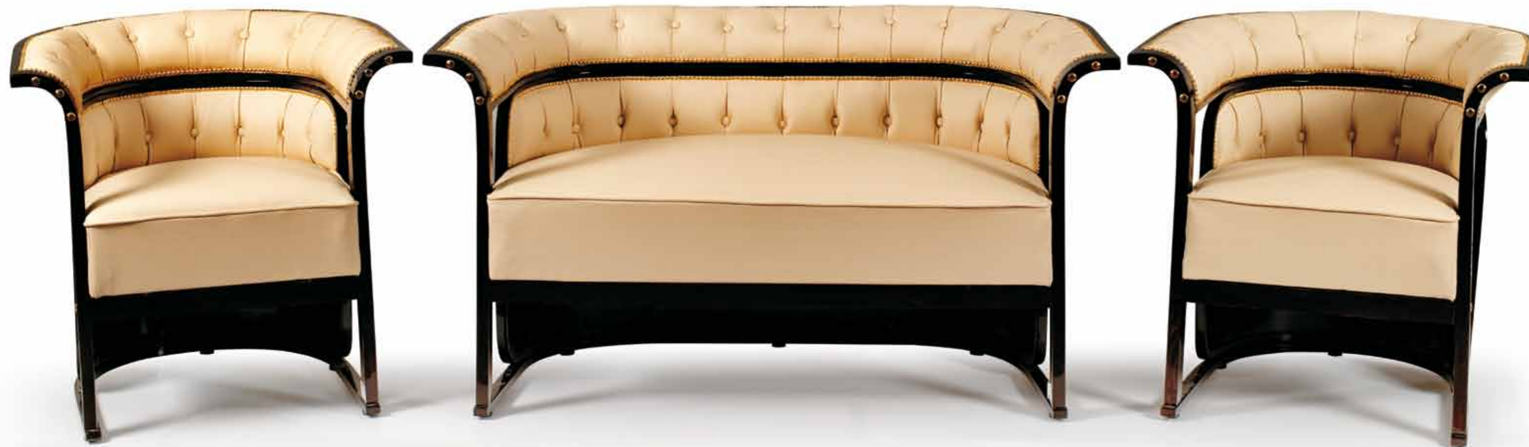
1. Josef Hoffmann, 1903