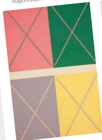
2. Josef Albers: The Interaction of Color, 1963 magántulajdon