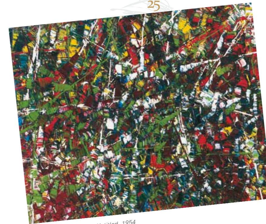
2. Jean-Paul Riopelle: Untitled , 1954 magántulajdon

szimbolizmusból a művészetébe. A negyvenes években már kísérletezett az élénk színekkel kitöltött kerek formával (pl. Egy pohár víz vigyázza a hernyó születését , 1943), a forgatható képpel ( Igaz királya , 1945 körül), megjelennek az elaprózódó motívumok, a kaleidoszkópszerűen kibontakozó kompozíció vagy a fátyolszerű réteg, a mozgás érzését keltő szélesebb ecsetvonások. Másfelől a gyermeki emlékek és álmok alapvető jegyei későbbi munkásságának. Erről Rozsda így írt: „ Azt álmodom, hogy olyan világban élek, ahol az idő dimenziójában járhatok, előre, hátra, föl, le, ahol felnőttként járhatok abban az időben, ahol a valóságban gyerek voltam. És most gyerekként vagyok öreg ”. 3 Rozsda művészete az idő körül forog, a különböző időrétegeket egymás fölé, mellé helyezi, újrameveri őket. Az emlékezés kapcsolat a múlttal, míg az álom a jövővel.