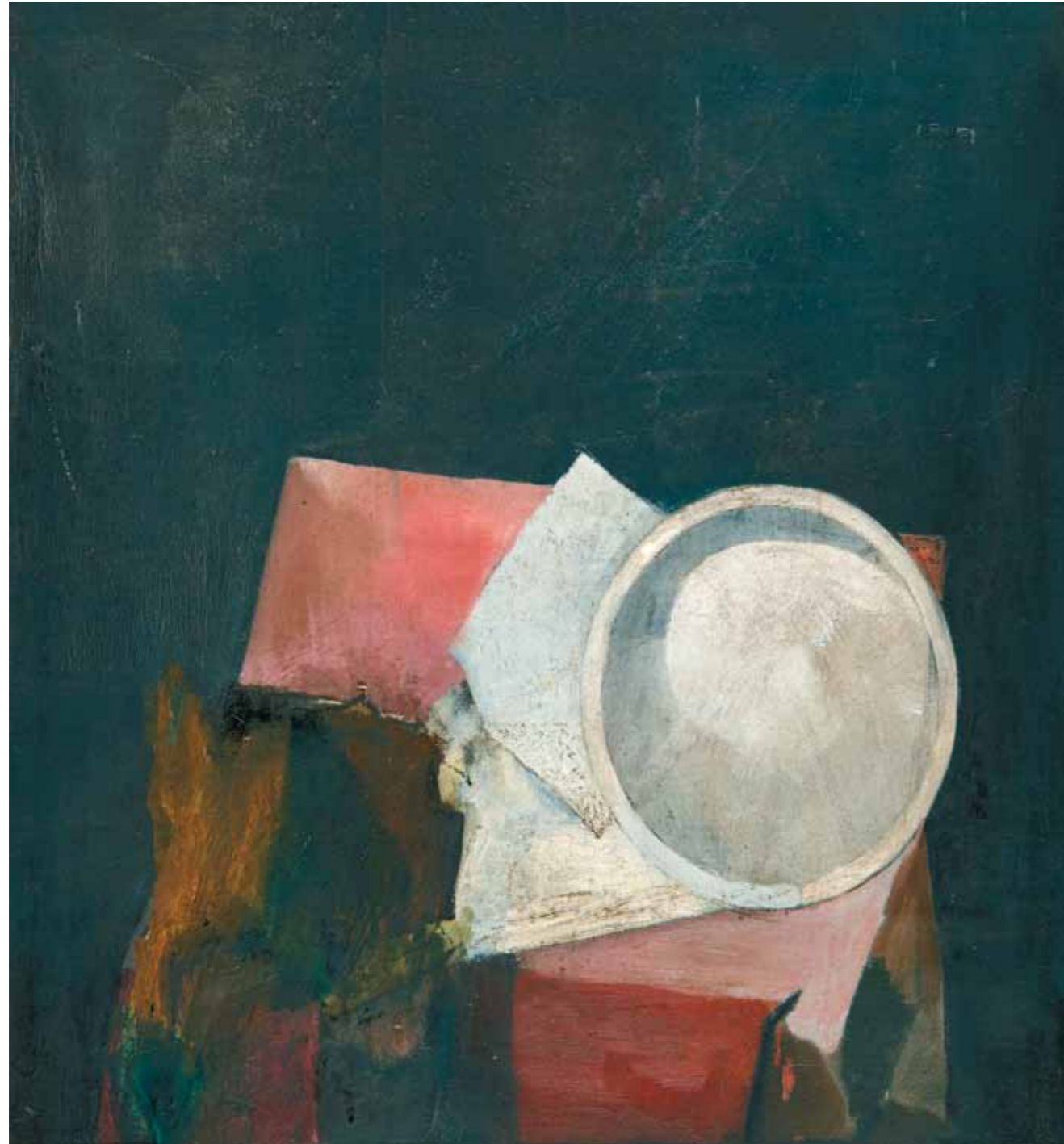
1. A kép hátoldala