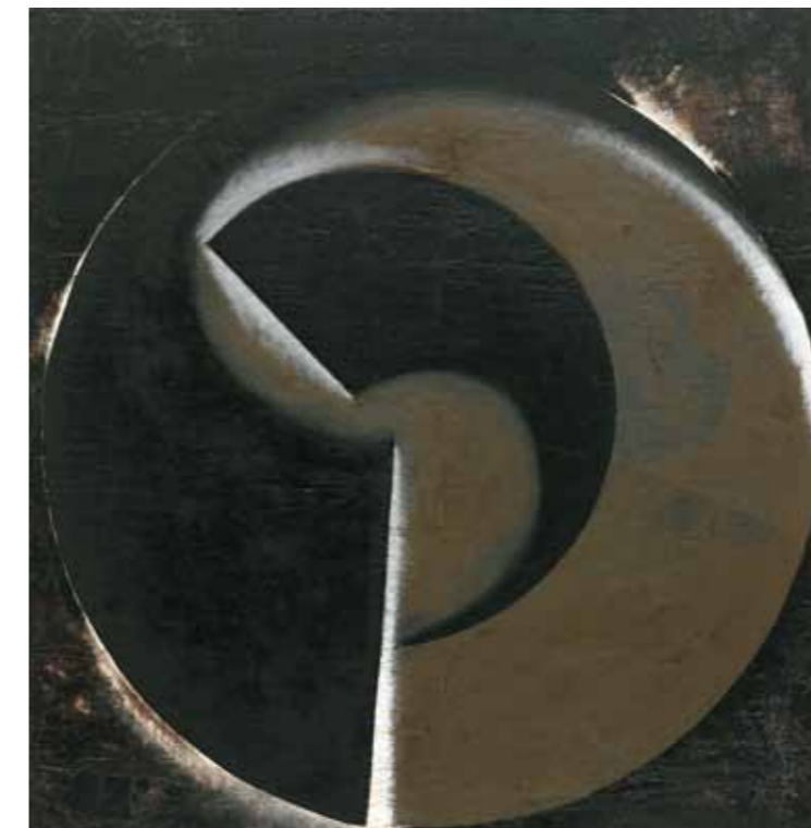
2. Alekszander Rodcsenko: Absztrakt mű, 80. (Fekete a feketén), 1918, MoMa, New York, USA