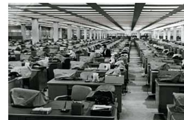
4. Trauner Sándor Oscar-díjjal jutalmazott díszlete a Legénylakás ( The Apartment , 1960) című filmhez