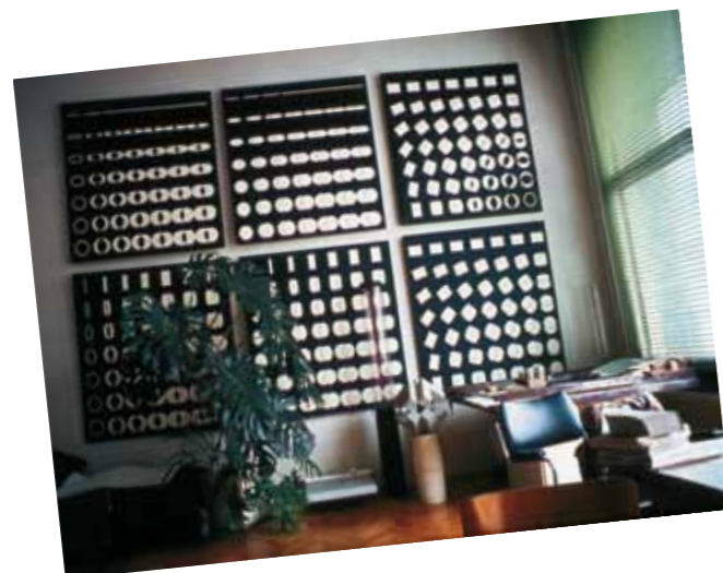
1. Mengyán András stúdiója

| Jubileumi képzőművészeti kiállítás. Magyarország felszabadulásának 30. évfordulója alkalmából. Múcsarnok, Budapest, 1975. április 19. - május 18.