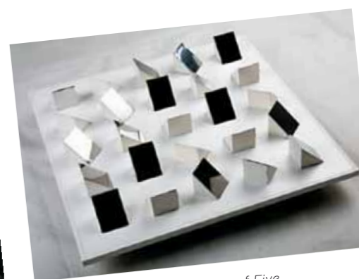
3. Mary Martin: Permutation of Five, Huddersfield Art Gallery, Anglia

A Formák logikájának alapelve az ismétlés nélküli permutáció („meghatározott sorrend”) megalkotása síkban és térben. Az egész képfelület egy (láthatatlan) rácsrendszert, négyzethálót alkot, amely felbontja a hagyományos képteret. Az egyes képelemek, jelen esetben a téglalap és a kör, egy bizonyos matematikai szabály alapján minden irányból (balról-jobbra, fentről-le, átlósan is) logikus rendszert alkotnak. Mengyán a térbeliséget nem a perspektíva módszerével éri el, hanem