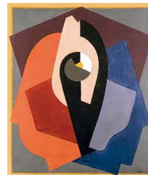
2. Albert Gleizes: Festmény, tárgy, 1921