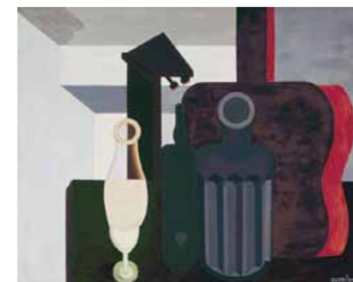
1. Amédée Ozenfant: Csendélet, 1921 magántulajdon