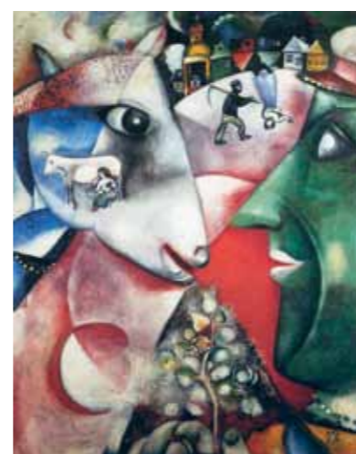
3. Marc Chagall: Én és a falu, 1911 MoMa, New York