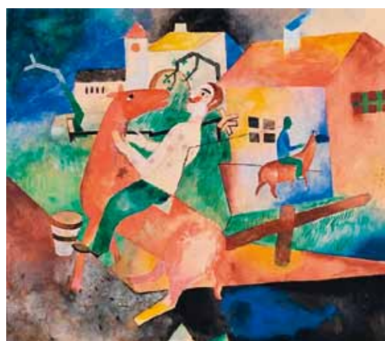
1. Heinrich Campendonk: A lovas, 1919 magántulajdon