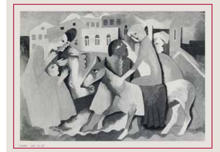
7. A Lánykérés reprodukciója a francia kiállítási katalógusban, 1980

lehetőséget a New York-i Brooklyn Múzeumban. Ezt követően Kádár több amerikai nagyvárosban rendezhetett kiállítást, így előbb vált ismertté a tengerentúlon, mint itthon, Budapesten.