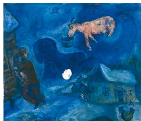
2. Marc Chagall: Falumban, 1943