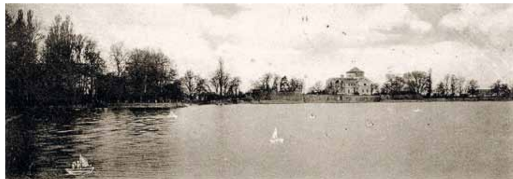
Tata az Öreg-tóval, archív felvétel