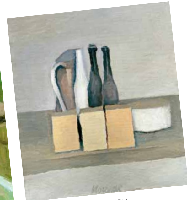
3. Giorgio Morandi: Still life, 1956 Museo di arte moderna e contemporanea di Trento e Rovereto, Giovanardi Collection 2008, ARS, New York / SIAE, Rome

struktúrái már nem egy konkrét, hanem általános, ideális városokra vonatkoznak (ld. Város, 1999; Atlantisz, 2000; Árkádia, 2000; Utópia, 2000 ). Bak „forrása” ekkor, egyfelől Peter Halley művészete, akinek több írását is publikálta, valamint 2015-ben közös kiállításuk volt. Halley neo-geo képein tárgyszerű-referenciális tartalmakkal bővíti a geometria tárgy nélküli világát, amelyek során bizonyos társadalmi kontextusra hivatkozik (pl. a szociális tér egyenlőtlenségeire). Maga ezt szellemesen úgy foglalja össze, hogy Barnett Newton sávjait az ereszcatornával cseréli fel, így nemcsak profanizálja a tárgy nélküli absztrakció