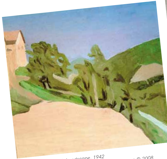
2. Giorgio Morandi: Landscape, 1942 The MET, New York, Zanichelli Editore, Bologna © 2008 Artists Rights Society (ARS), New York / SIAE Rome