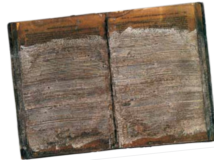
4. Lakner László: Cim nélkül (részlet A festészet számára meghódított lapok sorozatból), 1975 Galerie Heimeshoff, Essen

sőt, lehet akár koncept is, hiszen egy nagy ívű, évtizedeken át különböző aspektusokból vizsgált téma ez Lakner életművében. Messzire barangolhatunk az időben a hordozó funkciójából és a festői technikából kiindulva, ha a telefonkönyvre a kilencvenes-kétezres évek mindennapi életének praktikus sorvezetőjeként, ha úgy tetszik „bibliájaként” gondolunk. Az impasto technika az ókorban is kedvelt enkausztafestészetből fejlődött tovább: meleg méhviaszt használtak a pigmenteket hordozó anyagon való eloszlásához, amellyel egyúttal a kép tartósságát is biztosították. A most kalapács alá kerülő 1989-es könyvobjekt színe az International Klein Blue -t idézi, a 2001-ben készült munka láttán pedig Lakner Isa, pur sorozatára asszociálhatunk, mely a homokra, koromra, porral keveredő vérre, agyagra emlékeztet földszíneivel. Hazai aukción most találkozhatunk először Lakner könyvobjektjével. Egy gyűjtemény meghatározó darabja azonban leginkább mégis azért lehet, mert „a folyton kísérletező Lakner számára a könyv emblematikus jelentőséggel bír: motivum, kiindulópont, melytől elrugaszkozhat, hogy később visszatérhessen hozzá, könyvművei életművének nemzetközileg tán leginkább ismert darabjai.” 4