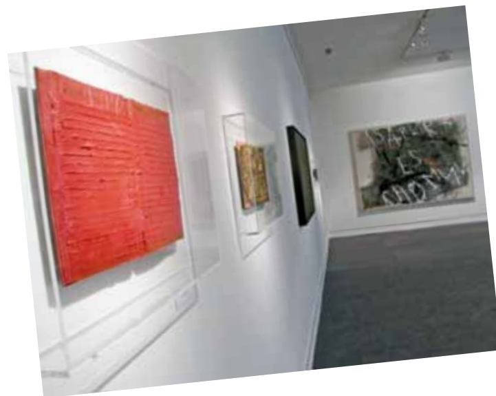
2. A sorozat párdarabja kiállítva Lakner László: Isa pur... , kiállításán, 2007. május 15. - július 15. Petőfi Irodalmi Múzeum, Budapest

Lakner első könyvobjektje egy kötéllel összekötött, Kmety utcai műtermének falára felfüggesztett Lukács György-kötet volt: „... egy napon, 1970-ben a műterembe lépve új szemmel láttam meg. Egyszerre észrevettem, hogy »megfogalmazással« állok szemben, hogy az összekötött könyv egy mű.” 1 1971-ben szitanyomatot készített róla, melyet az 1972-es velencei biennálén kiállítottak. Ezt a munkát a párizsi Picasso Múzeum igazgatója vásárolta meg, mely az első nagy lépés volt Lakner nemzetközi köztudatba való kerülésének.