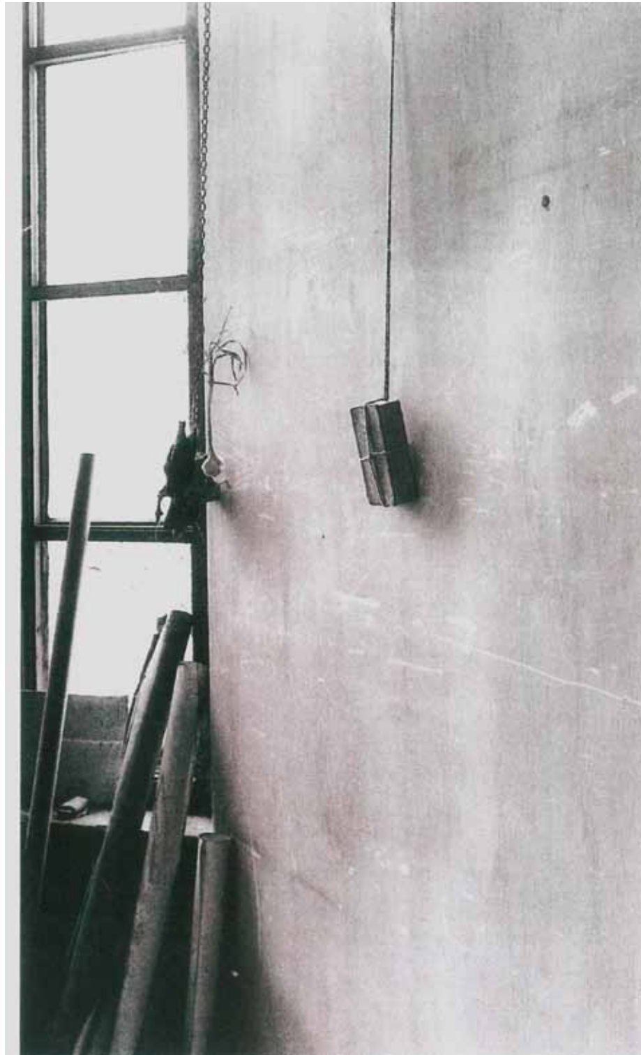
3. Lukács György fellógatott könyve a festő Kmety utca műtermében, 1965

Az itthon elkezdett könyv-sorozatának darabjai a megkötözött, politikai-társadalmi témákra reflektálnak és csukva vannak. 1974-ben Lakner Berlinbe költözik, és 1975-ben könyveit kinyitja: A festészet számára meghódított lapok címet viselő akció keretében a könyv lapjait széles ecsettel, sok festéket használva fehérre mázolja. Ennek az akciónak a folytatásaként értelmezhető a most aukcióra kerülő két tárgy is. Lakner egy teljesen hétköznapi tárgyat használ fel; egy telefonkönyvet emel be a kiállítótérbe, amely ezen aktus által képzőművészeti alkotássá válik – így tekinthetünk rá duchamp-i ready-made-ként is. Míg korai könyvmunkái alapját többségében egy-egy ideológiát megtestesítő szellemi termék adja, melynek megkötözése politikai, kulturális üzenettel bír, ezzel szemben a telefonkönyv a gyakorlati élet praktikus eszköze, célja csupán az információközlés. Egy használati tárgy, amely meg van fosztva eredeti funkciójától, hiszen fellapozhatatlanná lett téve, mint ahogyan a szöveg is olvashatatlaná vált benne a ráfestés által. „Paradox módon a szöveg eltüntetése által válik láthatóvá a könyv könyvszerűsége. Lakner azért fosztja meg a könyvet eredeti funkciójától, hogy láthatóvá váljon mint egy sajátos tárgy.” 2