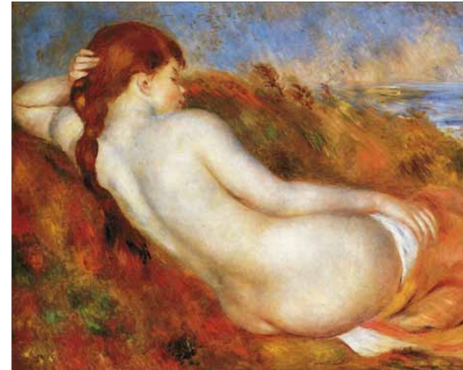
3. Pierre-Auguste Renoir: Fekvő akt, 1883