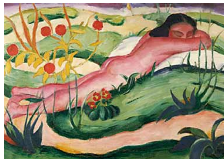
1. Franz Marc: Fekvő akt, 1910