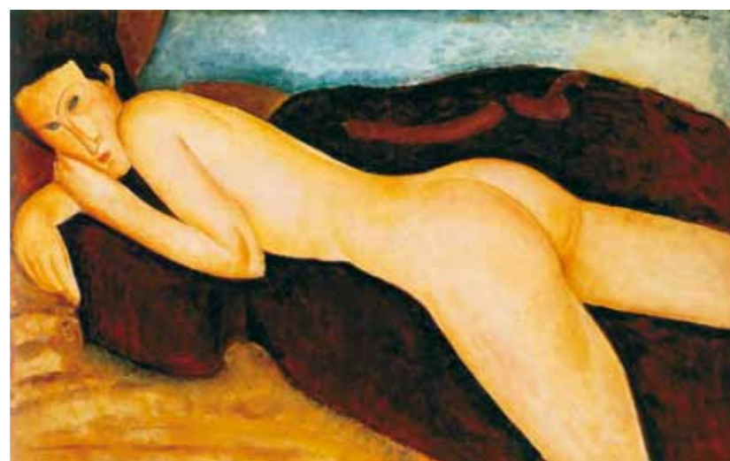
2. Amedeo Modigliani: Fekvő akt, 1917 Barnes Foundation, Philadelphia

Az aktbrázolás Vaszary János teljes életművén átívelő, folyamatosan jelen lévő művészeti program volt. Korai párizsi naturalista tanulmányait a századfordulón szecessziós-szimbolista stílusú remekművek követték, majd az első nagy világegés előtt impresszionista, azt követően pedig expresszív formaképzésű aktokkal jelentkezett. Vaszary mindig naprakészen kapcsolódott a korszellemet kifejező stílusirányokhoz, így a két háború közötti időszak egyik legmeghatározóbb ösztönművészeti ágához, az art decohoz is szervesen ízesült festészetével. 1925 körül a nagyvárosi élet és a nyaralási szokások gyökeres megváltozása, úgy Európában, mint a tengeren túlon is, alapvetően alakította át a vizuális kul-