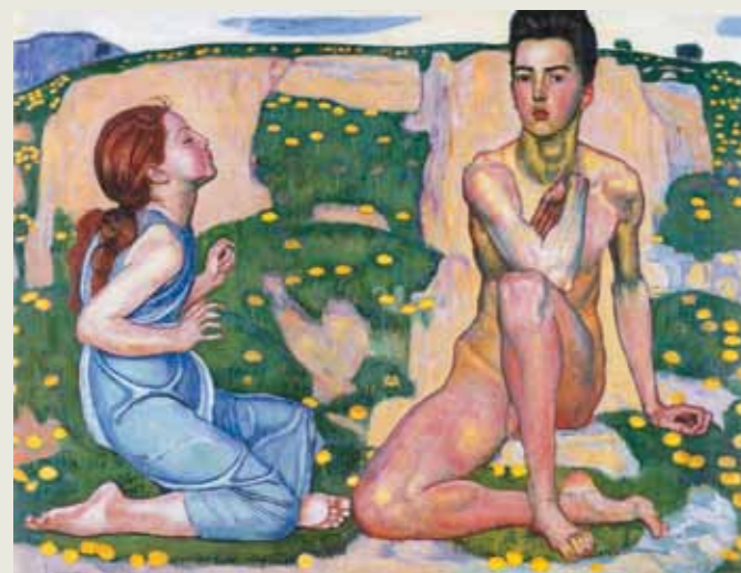
1. Ferdinand Hodler: Tavasz, 1901