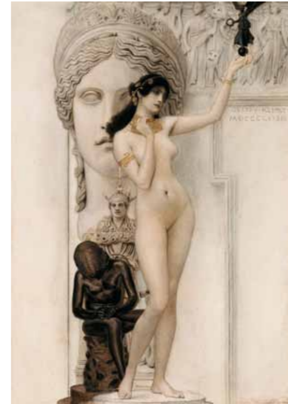
3. Gustav Klimt: A szobrászat allegóriája, 1889