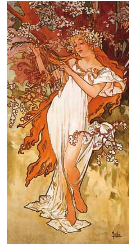
4. Alfons Mucha: Tavasz, 1896

betűk, szavak vagy verssorok is megfeleltethetőek a különböző színeknek. A szimbolista festők által kedvelt szinesztézia-elméletekben a különböző érzékek összekapcsolódnak, és hangulati alapon való azonosításuk magasabb szinten fejezi ki a festő, költő vagy zeneszerző által megálmodott ideát. A színekkel kifejezhető zeneiség Gulácsy festészetének épp olyan lényegi meghatározója, mint az általa 1908-ban méltatott Klimt művészetének. A színakkord és színszimfónia szóösszetételek Gulácsy számára valóságosan átélhető élményt jelentettek. Ahogy az általa imádott reneszánsz művészetnek, úgy festészetének is egyik kulcsfogalma a nosztalgia. Vágyakozás elmúlt vagy sosem létezett dolgok, vélt vagy valós események után, csillapíthatatlan sóvárgás az elveszett „aranykor” iránt. Mindennek megidézésére szolgáltak azok a misztikus hangulatú jelmezes előadások is, melyeknek Gulácsy tevékeny részese volt,