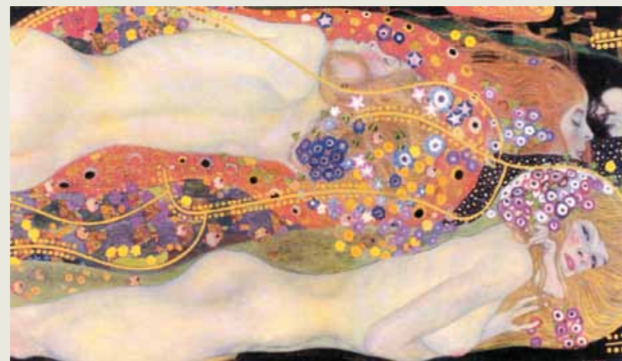
2. Gustav Klimt: Vizikigyók II., 1907 Magántulajdon

„Gulácsy Lajos, abszolút festő. A vonalon, színén és formán túl azonban más is érdekl. Elsősorban költő, aki ecsettel írja álmait. [...] Ebből következik természetesen az is, hogy benne a költő és piktör elválaszthatatlanul egyesül tökéletes harmóniában. [...] Gulácsy az emlékezések poétája s képein mindig ott érezzük a jelen és a múlt közt fátyolosan úszó levegő gyöngyszürke tónusát. A tavasz, amelyet fest, nem most ragyog a kipattanni készülő enyves gesztenyebarkák közt, rég elmúlt tavasz az, amelyre valaki egy őszi estén emlékszik vissza” – írta Kárpáti Aurél 1913-ban. Gulácsy életművében a festészet, a költészet és a zene elválaszthatatlan egységben forrt össze.