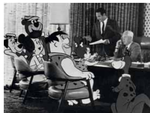
3. Joseph Barbera és William Hanna a Hanna-Barbera Production irodájában karakereikkel, 1969