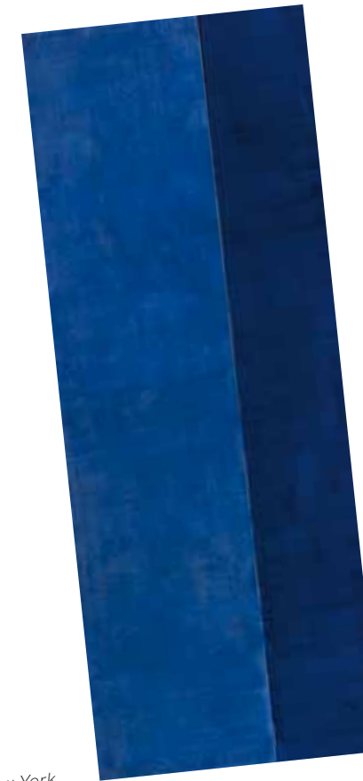
2. Barnett Newman: Ulysses, 1952 The Barnett Newman Foundation, New York

Nádler István életműve egymástól elhatárolható korszakokra bontható, melyben az egy-egy sajátos problémakört feldolgozó műciklusok kisebb egységeket alkotnak. Művészetének fontos alapelve az érzelmi nyitottság, a történelemre vagy a magánéleti eseményekre való visszahatás, melyeknek következtében strukturális és formai kérdésfelvetései érzelmi, hangulati elemekkel telnek meg. 1 A kilencvenes évektől többnyire a keleti filozófiák és a zene hatására, inkább a lírai megoldások, festészeti gesztusok felé fordult. Ekkori munkáin a korábbi (meghatározó) geometrikus formáit széles ecsettel felvitt egyszerű, mégis lendületes, sodró erejű felületek egészítették ki. Új képi világában így tovább élnek a „nádleri szenzuális geometria” alapelemei, azonban az érzelmi, hangulati, narratív képi elemek szerepe megnő, és a képfelület „vizionárius, expresszív jellege válik döntővé”. 2