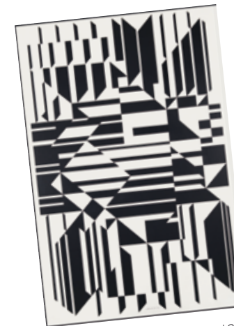
4. Victor Vasarely: Tilla, 1958 Le Musée en Herbe

kompozíció, de olyan erőteljesen kell megformálni, hogy hatása ne csak egy példányra korlátozódjék. A »sokszorosított művek« végeredményben olyan egyedi darabok, amelyek már keletkezésük pillanatában nem egy példányban, hanem száz, vagy annál több »eredetiben« léteznek. Ennél pontosabb definíciót nem tudok adni. Bármilyen művet hozunk létre, mindig van egy eredeti, de idáig ez az eredeti volt alkotója végcélja, nálam pedig csak a kiindulópont.”