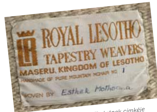
1. Lesotho királyi szövőműhelyének címkeje a falikárpit hátoldalán