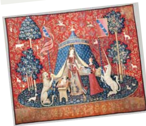
3. Ismeretlen mester: A hölgy és az unikornis, 1484-1500 Musée de Cluny, Paris