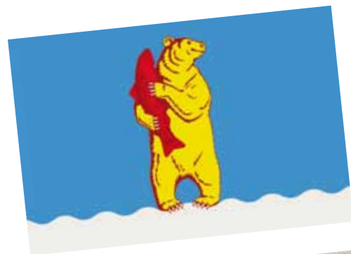
2. Anadir, az oroszországi Csukcsföld fontos kikötővárosának zászlója