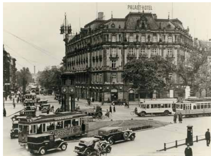
1. Berlin, 1920-as évek