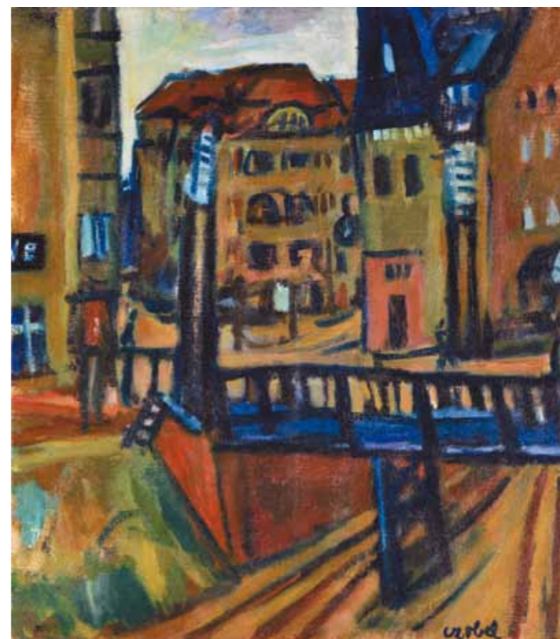
3. Czöbel Béla: Berlini utca, 1900-as évek első fele magántulajdon