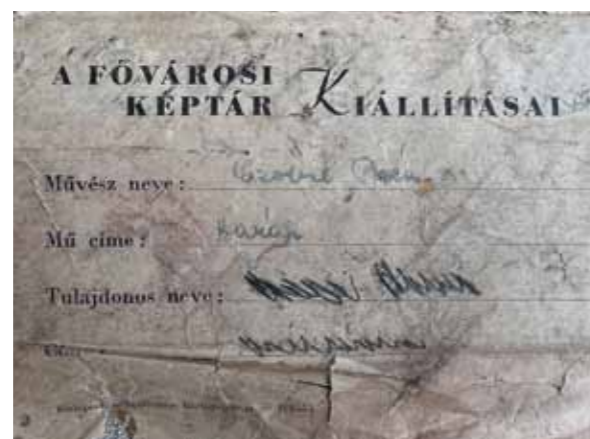
A festmény hátoldalán található kiállítási etikett