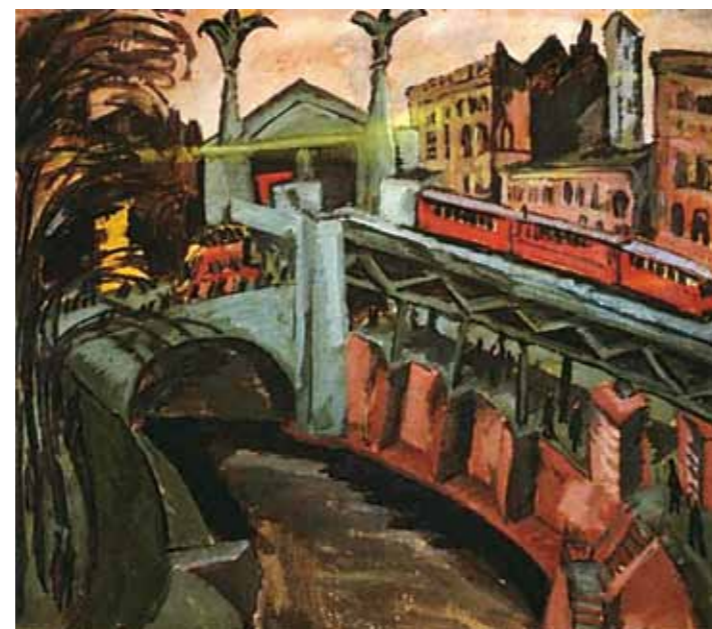
2. Ernst Ludwig Kirchner: Halleisches Tor, Berlin, 1913

Éppen és pontosan egy évszázada, hogy Czobel Béla megfestette a most aukcióra kerülő képét. Festményén Berlin, vagy valamely ehhez közeli németországi város egyik kisebb, házakkal körülfogott terét ábrázolja, melynek közepében egy szoboralakkal díszes kút helyezkedik el. Bár a festő katonai mentesítést kapott az első világháború kitörését követően, de az ennek dacára szinte biztos internálást elkerülendő, Párizsból a hollandiai Bergenbe költözött. 1919-ben innen ment tovább Berlinbe, a magyar emigránsok egyik legfontosabb gyűjtőhelyére. „Alig van városa a világnak, amely oly gyorsan lendült volna a fejlődés legmagasabb fokára, mint Berlin. A képzőművészetek egyre otthonosabbá lettek