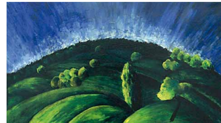
3. Moholy-Nagy László: Budai Hegyek, 1918 Antal-Lusztig gyűjtemény