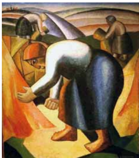
1. Kazimir Malevics: Aratás, 1913 Moscow Museum of Modern Art, Moszkva