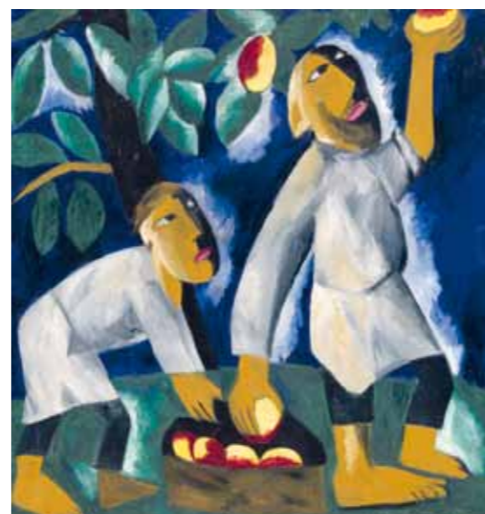
4. Natalja Goncsarova: Almaszüret, 1911 Tretyakov Képtár, Moszkva

pedig már magángyűjteményben vagy barátok tulajdonában volt, annak jobb volt titokban maradnia az esetleges retorziók miatt. Nem volt ez másként akkor sem, amikor már Bortnyik fontos tisztségeket (pl. a Képzőművészeti Főiskola rektora) töltött be a magyar képzőművészeti életben a felszabadulás után, hiszen aktivista múltját az ötvenes-hatvanas években lényegében tabuként kezelték. Azóta egy fokkal jobb a helyzet. Bortnyik halála után rendezett emlékkiállítás 1977-ben, már három 1918-ra, és négy 1919-re tehető olajkép szerepelt közgyűjteményekből. A rendszerváltás után pedig lassan fel-feltűnnek lappangó korai grafikák és festmények itthoni gyűjteményekből vagy külföldi (főleg német és osztrák) árveréseken.