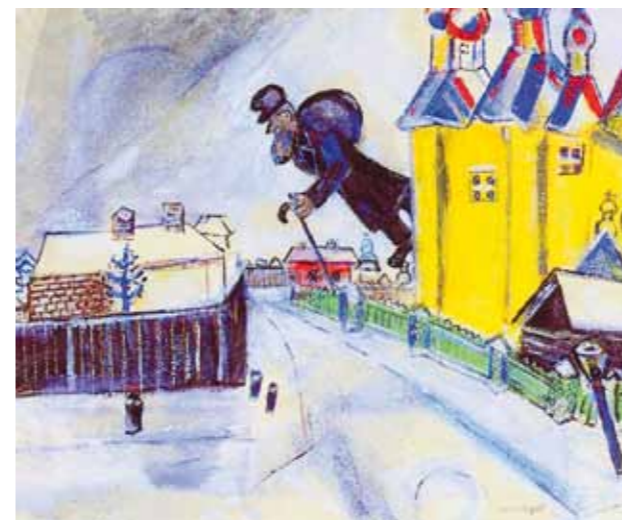
2. Marc Chagall: Vicebszken át, 1914 Philadelphia Museum of Art, Philadelphia

Bortnyiknak erről a fontos és rövid első művészi periódusából (amely 1917-18-tól 1919-ig tartott) meglehetősen kevés mű ismert. 1969-ben Borbély László azt írja, hogy „a festmények többsége még nem került elő”, a Ma III. kiállításán (1918 szeptemberében) bemutatott hat olajkép közül például egyik sem. 2 Mind ez több dolognak is köszönhető: egyfelől az alkotások nagy része (nyersanyag és anyagi forrás hiányában) papírra (vagy kartonra) készült, így könnyebben elveszthetett, elpusztulhatott. Másfelől Bortnyik – a többi aktivista művészhez hasonlóan – a Tanácsköztársaság bukása után elhagyta az országot, és Bécs-be emigrált. Amit tudott magával vitt, ami