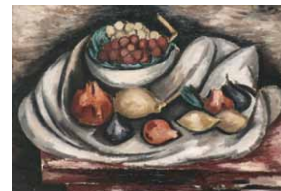
5. Marsden Hartley: Csendélet gyümölcsökkel, 1928 Phoenix Art Museum, Arizona, USA