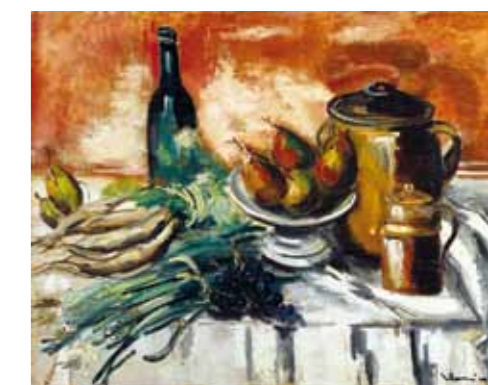
6. Maurice de Vlaminck: Csendélet körtékkel, 1928 körül magántulajdon

Az Almák azon ritka magyar műalkotások sorába tartozik, mely nemcsak naprakészen, de valódi kvalitásokat is felmutatva kapcsolódott a korabeli francia festészet főáramához, ezen belül pedig a huszadik századi európai képzőművészet egyik legnagyobb hatású mestere, Henri Matisse festészetéhez.