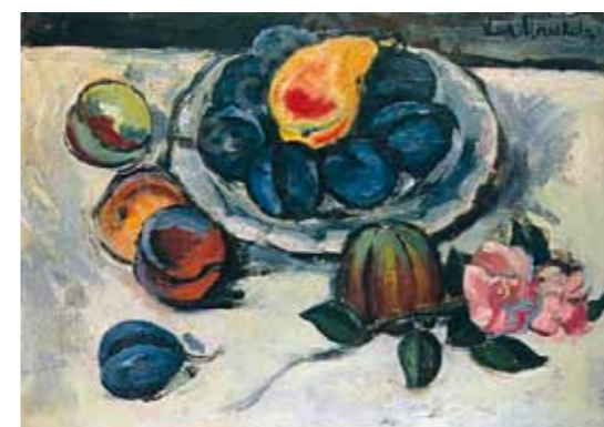
4. Ilya Mashkov: Csendélet szilvával, 1910-es évek eleje