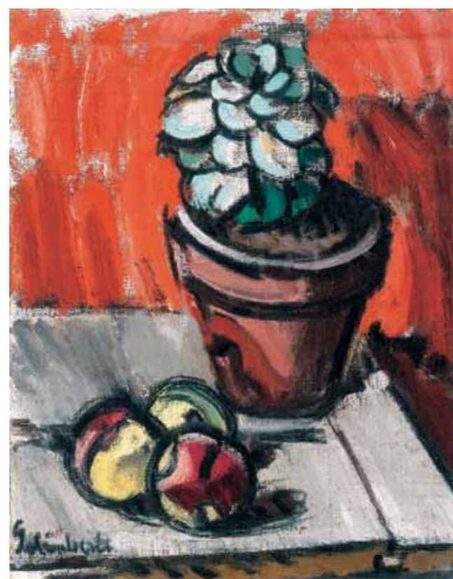
3. Galimberti Sándor: Virág- és gyümölcsccsendélet, 1911 magántulajdon

Galimberti Sándor a korai magyar modernizmus egyik legmeghatározóbb alakjaként ismert. Lenyűgöző az a naprakészség, ahogy feleségével, Dénes Valériával közösen kapcsolódott a századforduló első évtizedének francia festői forradalmához. Mindketten kimagasló tehetségű művészek voltak, akiknek fiatalon megszakadt életműve teljesen egységes és ingadozások nélkül kiváló minőségű. Galimberti Nagybányán ismerkedett meg a művészettel és a szerelemmel is. 1903-tól dolgozott a nagybányai művésztelepen, ahová 1915-ben bekövetkezett haláláig szinte minden nyáron visszatért. Itt ismerkedett meg 1907-ben Dénes Valériával is, hogy azután Párizsban együtt szerepeljenek műveikkel a híres Független Szalonja és az Őszi Szalon tárlatain. Mivel Dénes Valéria 1910 és 1912 között Henri Matisse tanítványa volt, így Galimberti elsőkézből értesült a francia Vadak legújabb vívmányairól. Ugyanakkor magyar művészbarátok révén pedig a kubisták kísérleteiről jutottak naprakész információkhoz. Párizsban született műveikkel itthon először 1913 decemberében mutatkoztak be, Mikola András nagybányai műtermében. Galimberti a következőket írta édesanyjának első, nyilvános hazai kiállításukkal kapcsolatban: „Próbaképpen itt pár festőnek megmutattuk képeinket, de ezek a festők csak bámultak. Mi furcsa van a mi képeinken, én nem értem?” Ezt követte 1914 februárjában a budapesti