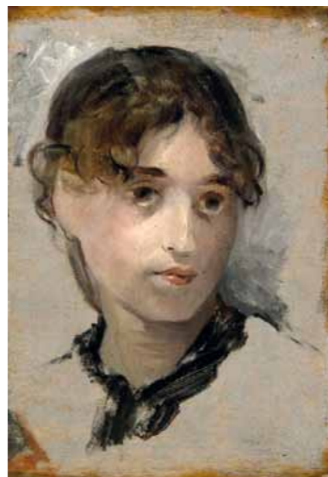
5. Eva Gonzales: Önarckép, 1880 körül