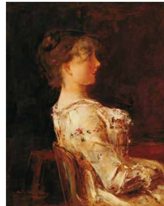
10. Munkácsy Mihály: Párizsi nő