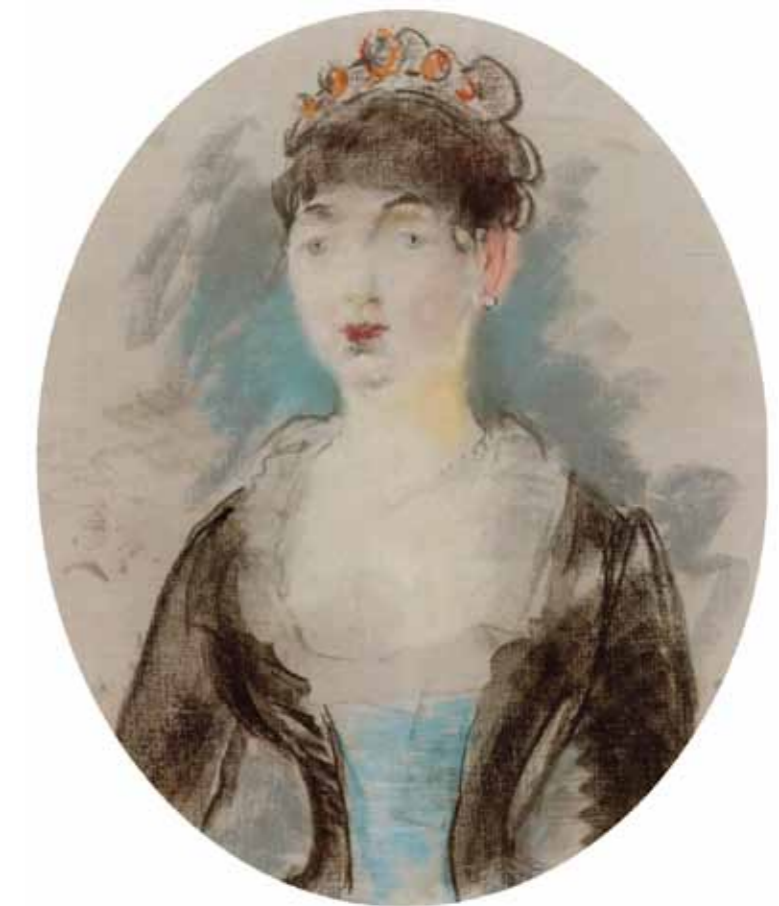
2. Edouard Manet: Madam Michel-Lévy