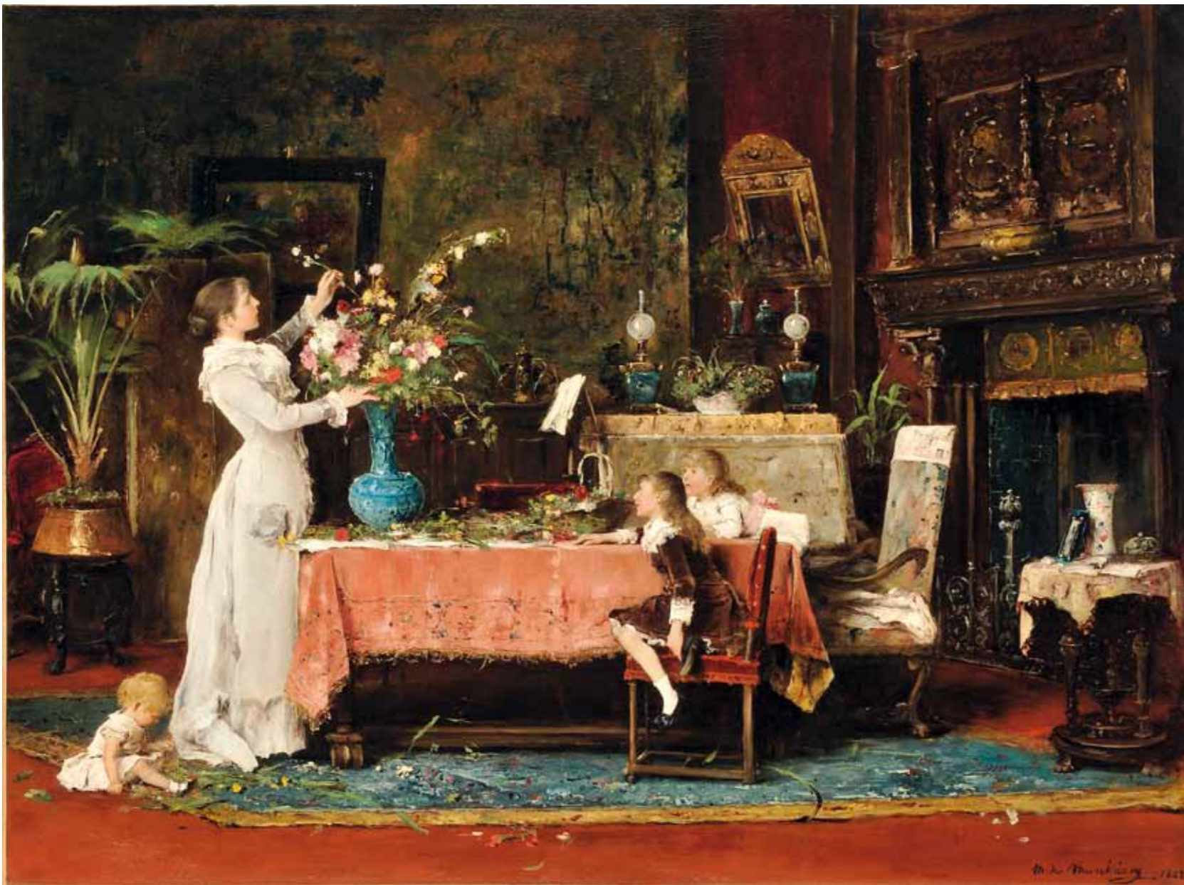
7. Munkácsy Mihály: Készülődés a papa születésnapjára , 1882 (Pákh-gyűjtemény)

fehér jelmezben. Meglátjuk, hogy hogyan fog ez megfelelni Knoedler kis képe számára." Knoedler 1877-ben egy „pihenő bohémeket” ábrázoló kosztümös zsánerképet rendelt Munkácsytól (írja a festő egy másik levélben) Realier asszony akár ehhez is ültetett modellt, és lehetett egyben modellje az itt tár-