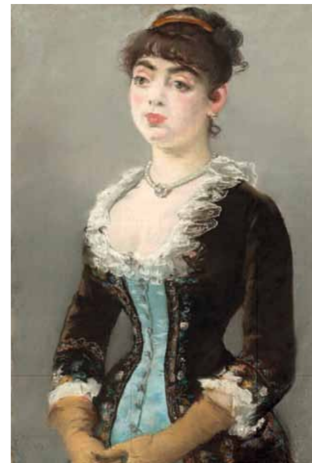
1. Edouard Manet: Madam Michel-Lévy, 1882