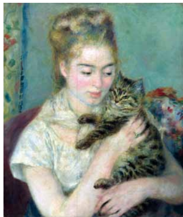
4. Auguste Renoir: Woman with a cat, 1875 National Gallery of Art Washington