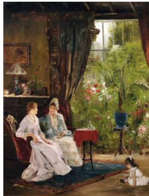
8. Munkácsy Mihály: Pálmaházban , 1885 körül, Pákh-gyűjtemény

követi a formákat, hol vékonyan, szinte rajzolva, hol puhán, szélesen elterülve foltszerűen érzékelteti a térbeliséget. Ezekon a portrékon általában kevés a szín, viszont a fény, miként az itt tárgyalt képen is, szinte átvilágítja a modellt.