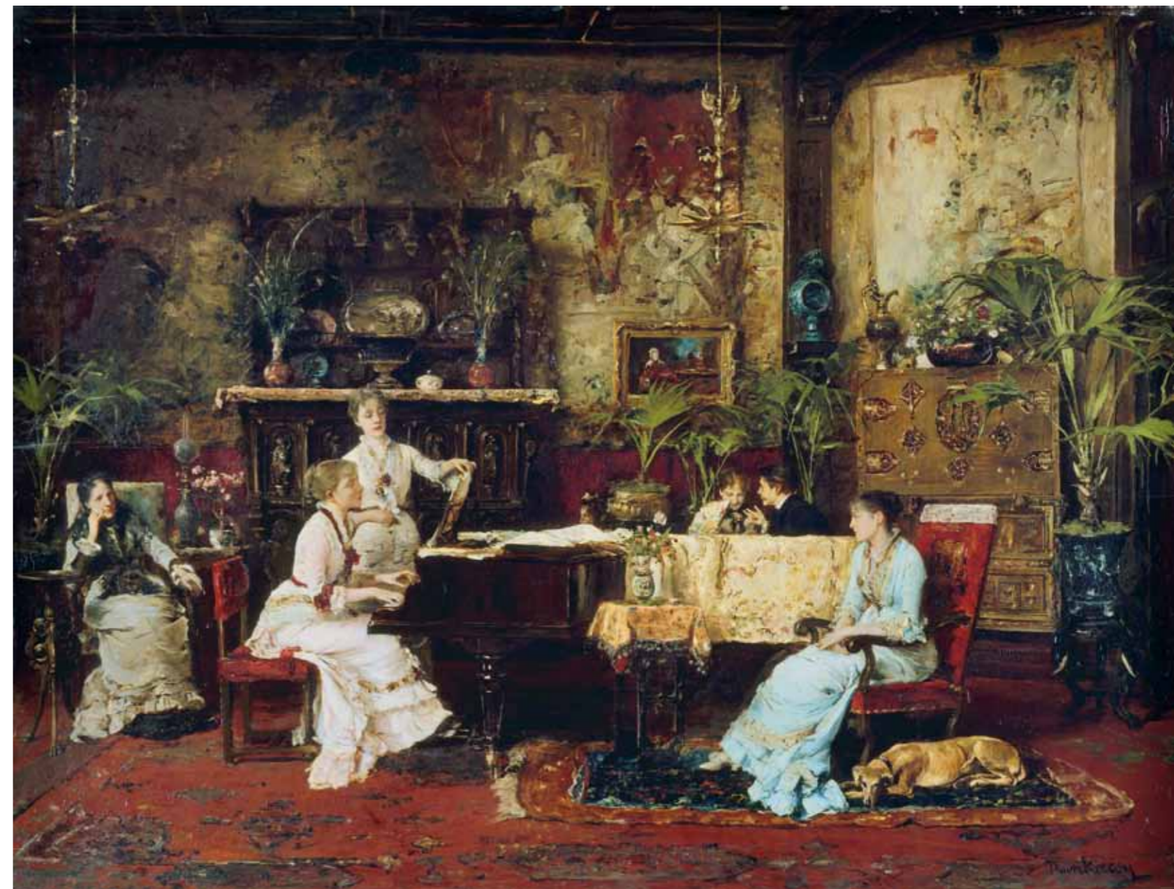
6. Munkácsy Mihály: Zeneszoba, 1878 (MET Lett. Szám 08.136.11)