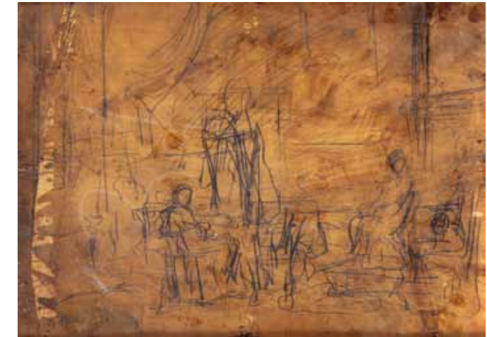
A kép hátoldalán található, műtermet ábrázoló ceruzavázlat