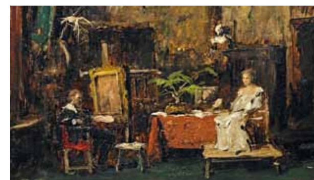
11. Munkácsy Mihály: Műterem V. , 1875-1876, Pákh-gyűjtemény