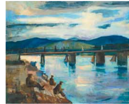
3. Bernáth Aurél: Pöstyéni híd, 1926 magántulajdon