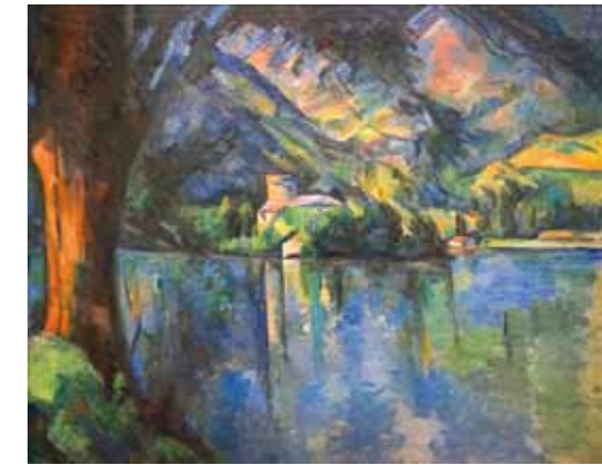
4. Paul Cézanne: Ancey-i tó, 1896 körül The Courtauld Gallery, London

Szőnyi István negyedszáz új alkotással jelentkezett az 1932. év művészeti évadában. Az eseményre márciusban került sor Tamás Henrik galériájában, a két háború közötti időszak budapesti művészvilágának egyik legjelentősebb helyszínén. Tamás 1928 és 1943 között a korszak legkitűnőbb művészeinek biztosított nyilvánosságot, és Szőnyi a galéria által rendezett tizenhat kiállításon vett részt műveivel ezekben az években. A most aukcióra kerülő Ősvényen című kompozíció, az 1932 márciusában bemutatott kollekció három, legmagasabb értékre becsült darabjának egyike volt. Joggal, mivel igazi főmű.