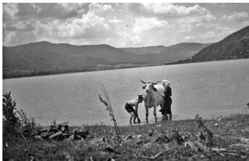
1. Bikafüdtetés, háttérben a Dunakanyar, 1938