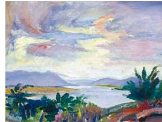
2. Márfy Ödön: Dunakanyar magántulajdon