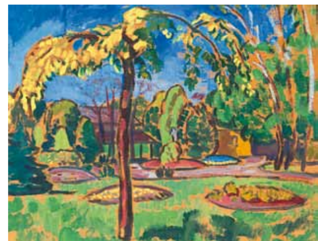
4. Iványi Grünwald Béla: Parkrészlet Kecskeméten, 1911-1912 magántulajdon