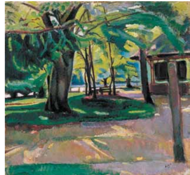
3. Erős Andor: Park, 1912 magántulajdon

A most aukcióra kerülő Műkerti részlet a kecskeméti művésztelep parkját ábrázolja. 1914. júniusi datálása bizonyítja, hogy a művész, egészen besorozásáig a kecskeméti művésztelepen dolgozott. A hasonlóságot és természetesi hűséget előíró, megrendelésre festett képek után, Erős ismét felszabadult, erőteljes színvilágú festményeken örökítette meg közvetlen környezetét. Műkerti részlet én a nyári lombkoronájuk ezernyi zöldjében pompázó fák közül előbukkanó egyik műteremvilla látható, a művésztelep parkjának sétányai, gondozott virágágyásai között. Erős Andor pár röpke évre korlátozott alkotói korszakának egyik legfontosabb ihlető forrása Paul Cézanne művészete volt. 1912 és 1914 között festett műveinek közelebbi hazai párhuzamai pedig Iványi-Grünwald Béla, Perlrott Csaba Vilmos, Tihanyi Lajos, Kmetty János és Nemes Lampérth József egykorú, expresszív és kubisztikus tájképeiben lelhetőek fel. Erős Andor életében talán félszáz olajképet és számos egyedi grafikát alkothatott. Az utóbbi években szórványosan felbukkant és közgyűjteményekben található művei, rövid élete dacára is a magyarországi posztimpreszionizmus egyik legjelentősebb képviselőjének mutatják. Az a kevés, ami még az eredetileg sem túlságosan nagyszámú életműből megmaradt, szerencsére egytől-egyig kiváló alkotás, nem ritkán remekmű.