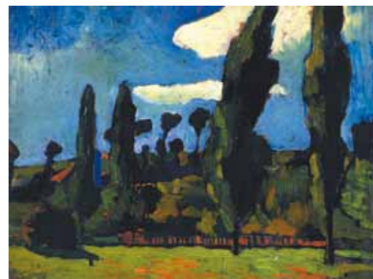
1. André Derain: Kastélypark, 1899 magántulajdon

mint Szolnokra és Kecskemétre.” (Ferenczy K. 1912). A fiatal művész tehát 1912-ben Ferenczy hathatós segítségével jutott el Nagybányára. Feltehetően itt festett művekkel mutatkozott be a nagyközönség előtt 1913 februárjában az Ifjú Művészek Egyesületének tagjaként. Két akttal és egy tájképpel szerepelt ekkor a budapesti Könyves Kálmán Szalonban, melyeket Bálint Rezső festőművész így méltatott a tárlatot ismertető kritikájában: „A kiállítás majdnem egyöntetű, mert egy kivétellel valamennyi kiállító ízléses, a polgári értesültségig színes képekkel szerepel. Az egy kivétel Erős Andor, akiért e sorokat érdemes megírni; három képet állított ki, melyeknek a megjelenése, felfogása egyenesen kiválik a kiállítás műcsarnoki átlagszínvonalából. [...] Az Erős Andoréhoz hasonló kvalitású kép nincs több a kiállításon...” (Bálint R. 1913)