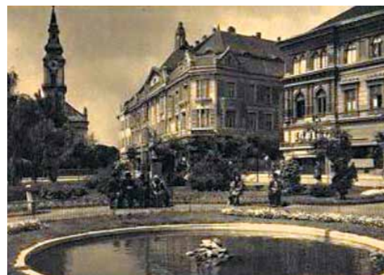
2. A kecskeméti park részlete az 1910-es években