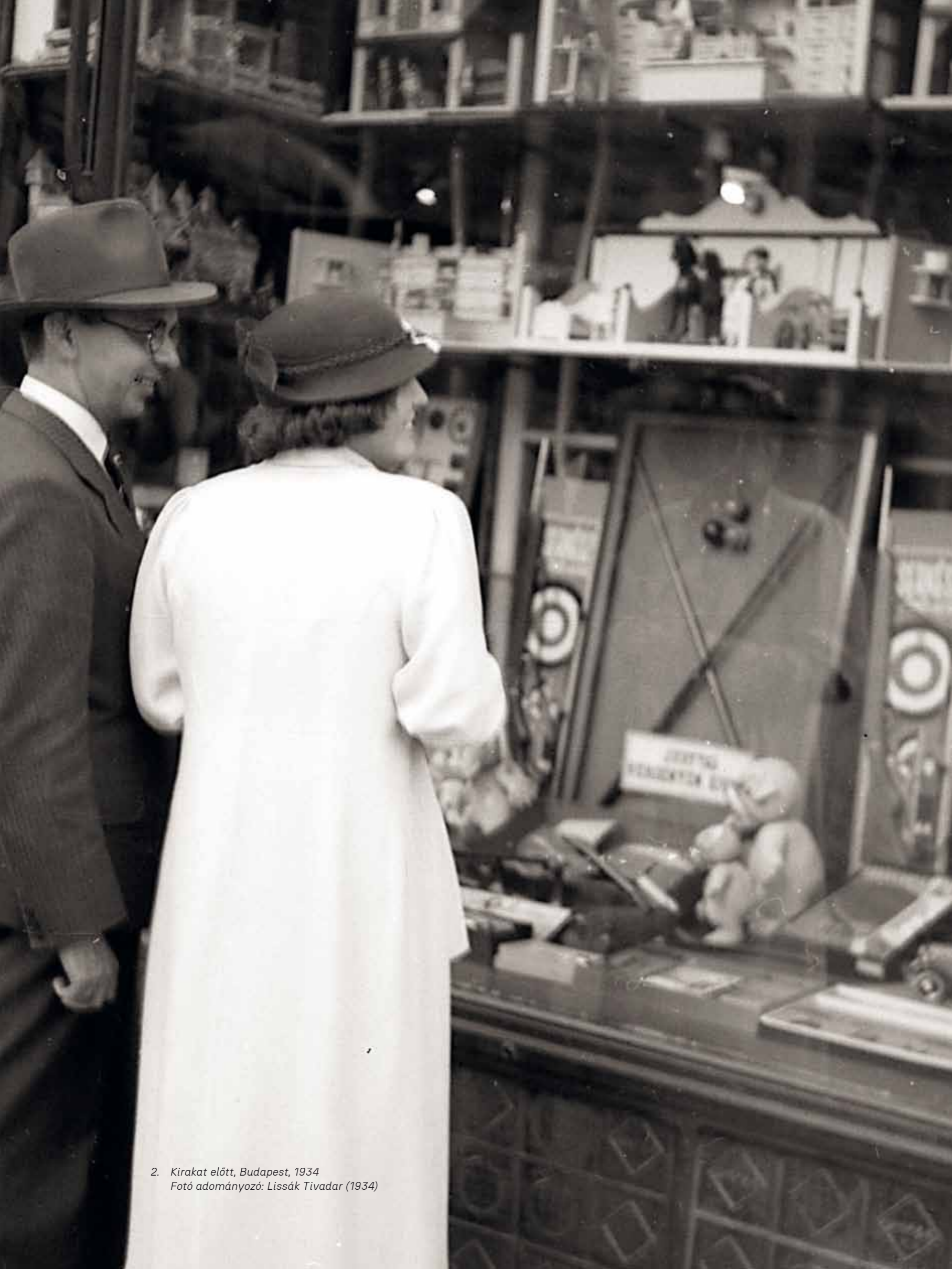
2. Kirakat előtt, Budapest, 1934 (1934)