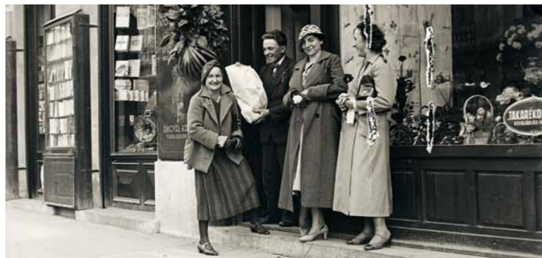
1. Kirakat előtt, Békéscsaba, 1935

Koszta huszoneves fejjel kezdte meg festészeti tanulmányait Bécsben, és 56 éves koráig kellett várnia első önálló kiállítására. Az 1917-es Ernst Múzeumbeli kiállításán a tehetséges „fiatal” magyar festőként ünnevelt érett Kosztát láthatta a nagyközönség, aki „Katóka - képeivel” és szentesi festményeivel vonult be a magyar művészettörténet-írásba. A magyar műkritika 1917-ben több cikket szentelt Kosztának, mint a festői pályán addig eltöltött jó húsz éve alatt összesen. A szentesi „birtokos” azonban ekkor már maga mögött tudta első erkölcsi és anyagi sikereit is. 1897-ben Hazatérők című képével elnyerte a Mű-barátok 1500 koronás díját, 1905-ben pedig a Fraknoi-ösztöndíjjal Rómába utazhatott. Az elismerések ellenére Koszta állandóan a vevők hiányára panaszkodott magánleveleiben, mindazonáltal kitartott a maga sajátos alföldi „finom naturalizmusa” mellett.