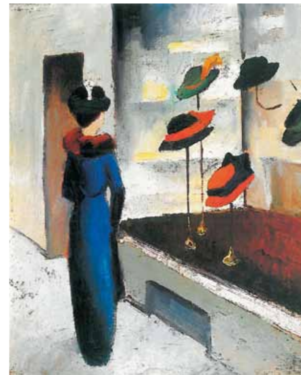
3. August Macke: Kalapboltban