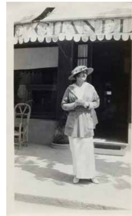
4. Chanel kirakat Párizsban, 1930 körül