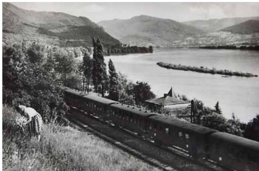
1. Zebegény, 1930-as évek

Kezdő ár | Starting price: 13 000 000 Ft / 32 500 EUR Becsérték: 18 000 000 – 24 000 000 Ft Estimate: 45 000 – 60 000 EUR