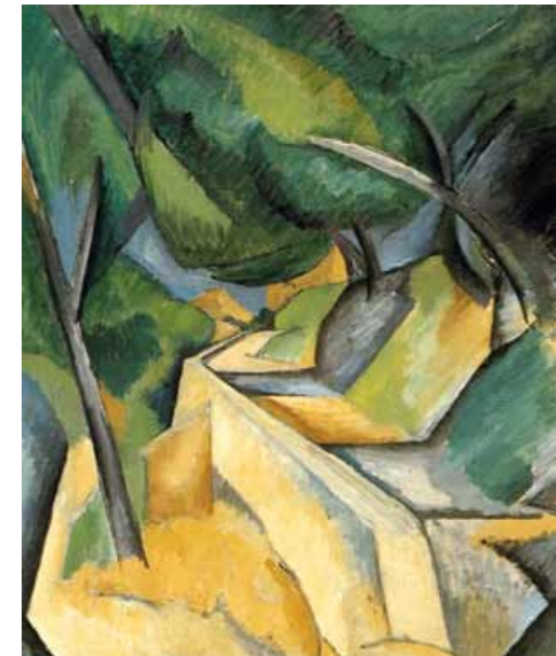
4. Georges Braque: Út Estaque mellett, 1908 Museum of Modern Art, New York

Bár Szőnyi hivatalosan nem töltött be vezetői szerepet semmilyen csoportosulás élén, karizmatikus személyisége és szakmai tekintélye mégis egyfajta informális vezetővé tette a fiatalok körében. Nagy hatással volt a húszas évekbeli ifjú neoklasszicista nemzedékre, többek közt Aba-Novák Vilmosra, Patkó Károlyra és Medveczky Jenőre. Zebegénybe költözése után barátai gyakran felkeresték, és lassan egy nem hivatalos művészkolónia jött létre a településen: „Most, hogy némileg rezignáltan gondolkodom vissza életem útjára [...] Mikor előbb említett kollégáim és még többen, jó barátaink kint voltak, sokat dolgoztunk, nagy problémákat feszegettünk, közben lejárunk a Dunára úszni és evezni, nagy kirándulásokat csináltunk kerékpáron az Ipoly és Garam völgyébe, Esztergomba, s a jól eltöltött, derűs és több-kevesebb munkaeredménnyel eltöltött minden hét szombatján összegyűltünk a kis kocsmában s cigány mellett mulatoztunk, nem ritkán reggelig tartó, régi magyar nótá-