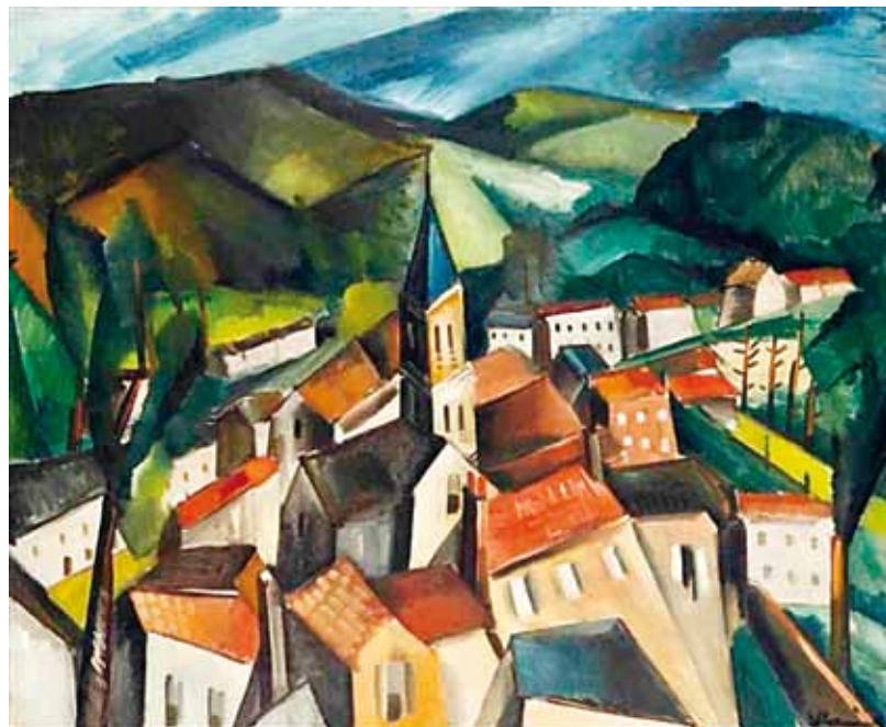
1. Maurice Vlaminck: Város a völgyben, 1910-11 körül magántulajdon