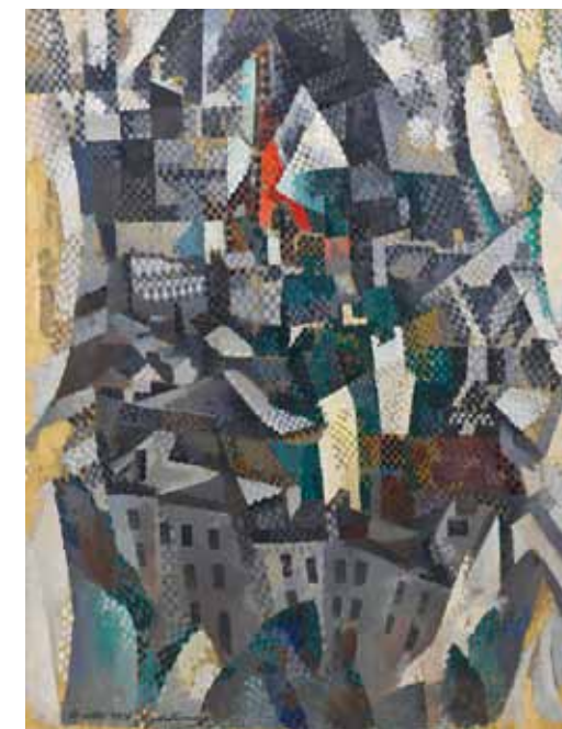
5. Robert Delaunay: A város, 1911 Solomon R. Guggenheim Museum, New York