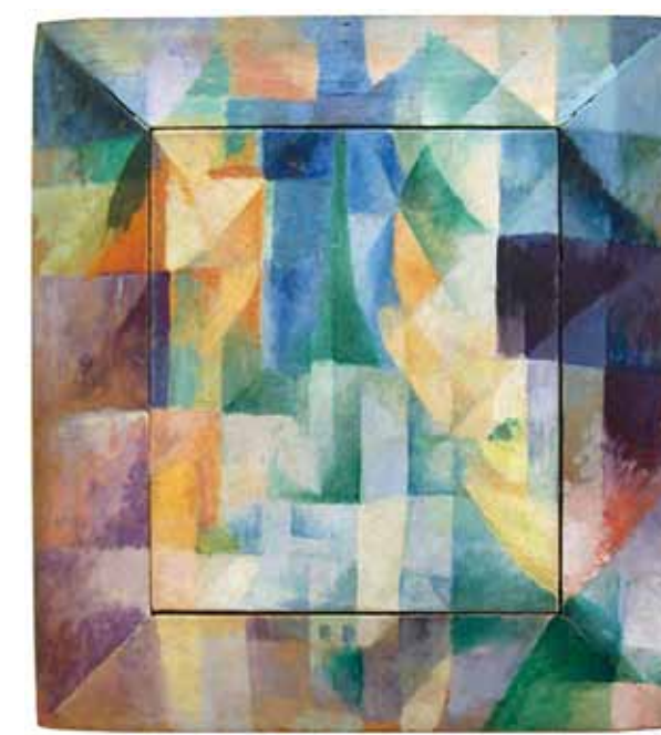
6. Robert Delaunay: Szimultán ablakok a városra, 1912 Kunsthalle Hamburg