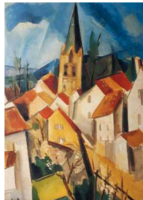
4. Maurice Vlaminck: Faluközponttal, 1910 San Diego Museum of Art, San Diego