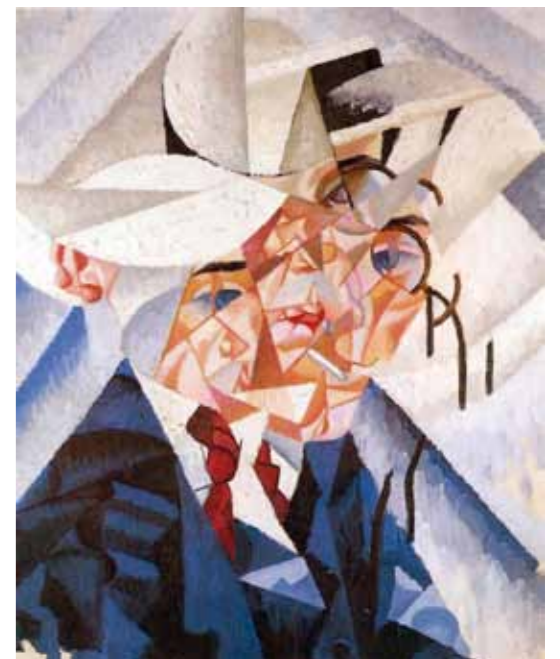
5. Gino Severini: Önarckép, 1912