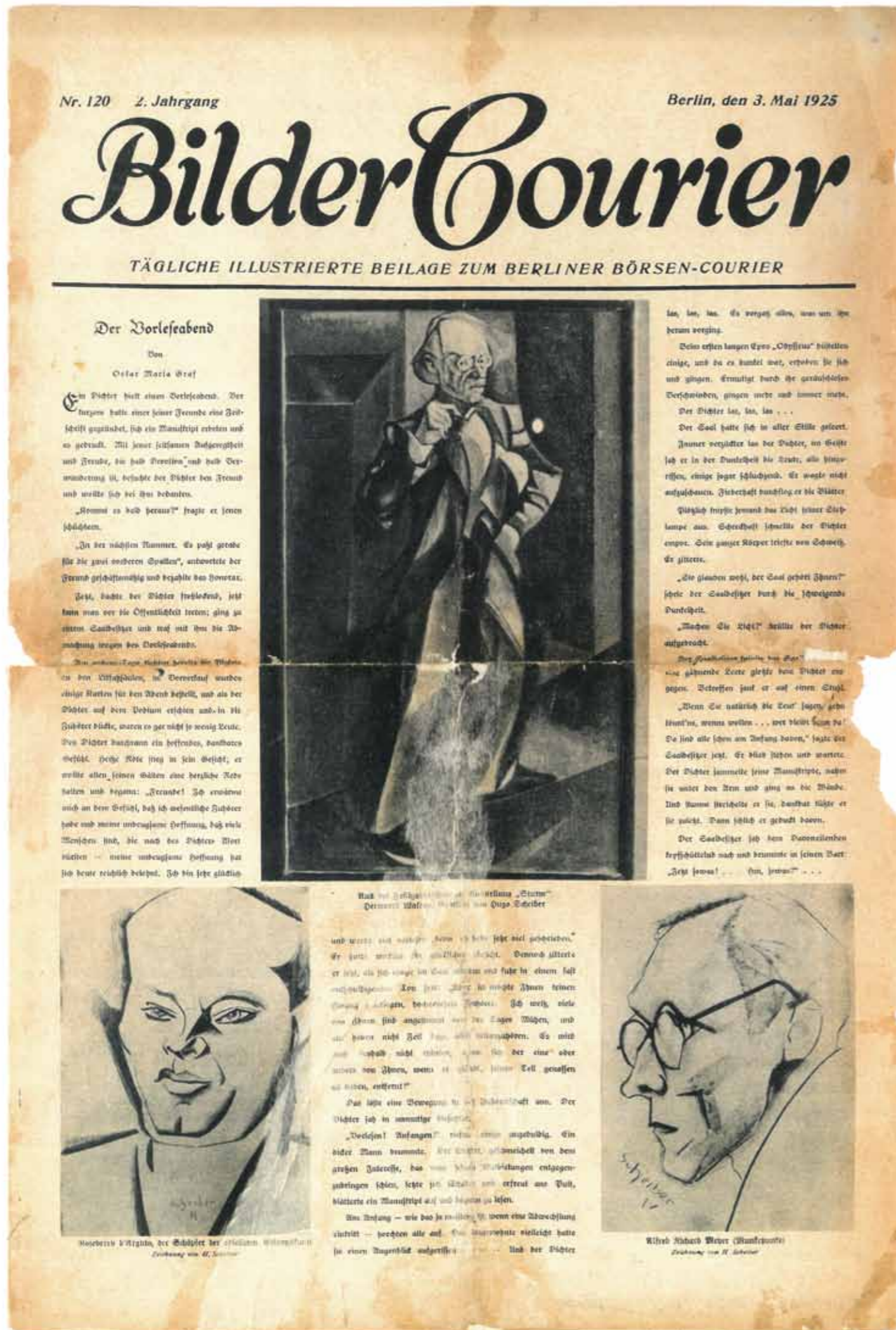
3. A berlini Bilder Courier címlapja, Scheiber portréinak reprodukciójával, 1925

Ezek a társasági események kiváló lehetőséget kínáltak Scheibernek, hogy a szélesebb közönség előtt is megmutassa portréfestői képességét, sőt, a korszak hírességeinek, politikusainak lerajzolásával még a kinti sajtó figyelmét is felkeltette. Leghíresebb modelljei közé tartozott a némafilmek sztárja, Asta Nielsen vagy az orosz balett legendás balerinája, Tamara Karsavina.