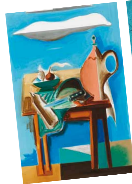
1. Korniss Dezső: Szentendrei csendélet, 1935 körül magántulajdon