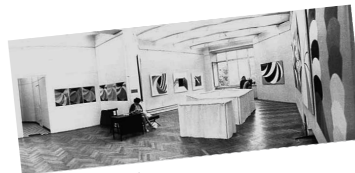
2. Archiv enteriőr fotó a Nádler-Jovánovics kiállításról

képpel lett kiállítva, melyek az ellentétes pólusok, mozgások összeütköztetésével foglalkoznak. A képet a vibrálóan színes alakzatok és a fekete-fehér sávok ellensúlya teszi igazán dinamikussá. A háttérből kiugró, szinte mozgásban levő formákat (mindhárom képen) megbontja egy a statikusságot jelképező – hol a háttérrel képviselő (Sárga, 1970), hol egy elválasztó elemként megjelenő (Ellentétek, 1970) – homogén, fekete színmező. A színek erejét tovább fokozza a homogén színmezők minden elválasztó elem, közömbösítő sáv nélküli megjelenítése. A kiállítás megnyitója Rádió akció néven vált híressé. Nádlerék ekkor a megtűrt művészek közé tartoztak, nehezebb körülmények között tudtak csak kiállítani. Jovánovics ezt a „diszkriminációt” akarta ellensúlyozni ötletével: „Az akkori kultúrpolitika jól ismert alapkonceptiója szerint mi, az úgynevezett »iparterveszek« a három T-ből a túrt és a tiltott