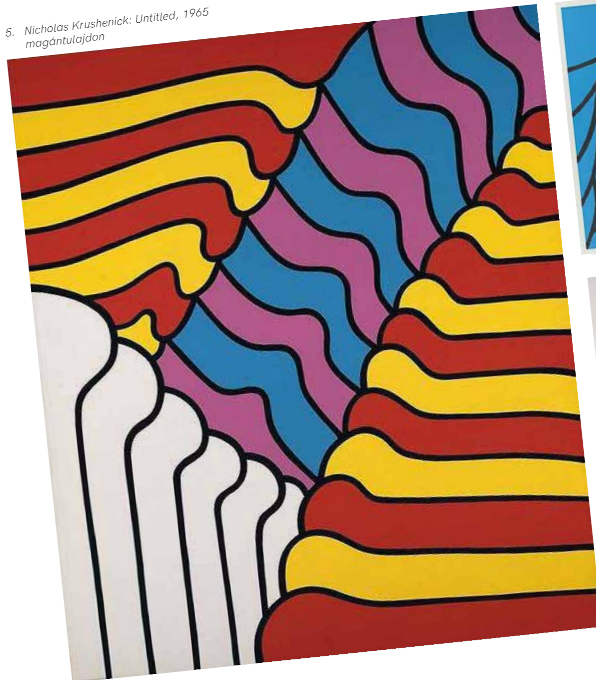
5. Nicholas Krushenick: Untitled, 1965 magántulajdon