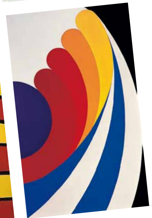
7. Nádler István: Szíromotívum Nr. 1, 1968 magántulajdon

mezsgyéjén álltunk. Ami azt jelentette, hogy egy ócska, emeleti galéria paravánokkal leválasztott, ötszögletű, kicsi termében, a Rákóczi úti Fényes Adolf teremben állíthattuk csak ki műveinket, ráadásul úgy, hogy mi fizettük a teremőr nénit, a meghívókat, a villanyszámlát és minden egyéb költséget. A pop art akkori állapotából továbbléptem az environment, az akció, az installáció felé. A művet Fényes Adolf terem objektnek