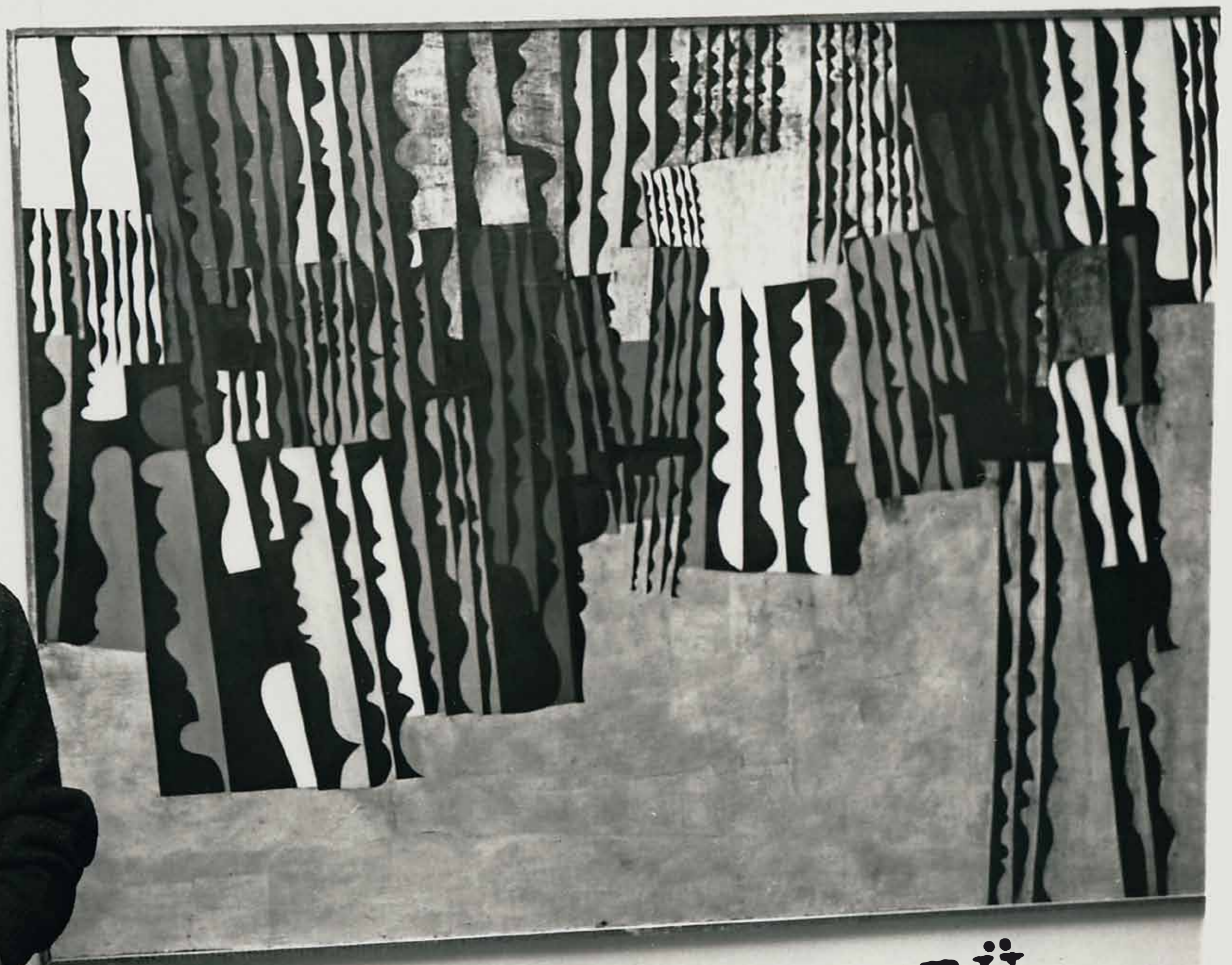
43. KESERÜ Ilona