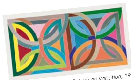
1. Frank Stella: Takht-i-Sulayman Variation, 1969 magántulajdon