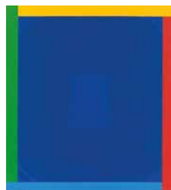
1. Georg Karl Pfahler: Cím nélkül, 1965 magántulajdon