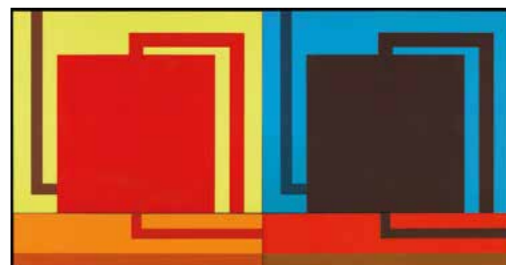
2. Peter Halley: Rob and Jack, 1990 Tate Modern, London