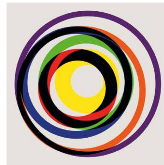
5. Max Bill: Variation 12. , 1938