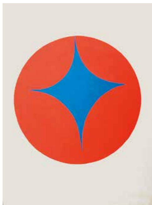
1. Leon Polk Smith: Tondo Red and Blue , 1967 magántulajdon

Fajó János harminchárom évesen rendezhette meg első önálló kiállítását. A Krisztusi kor, mesterének, Kassák Lajosnak az 1967-es halála, valamint ezáltal a magyar avantgárd művészet egyik kulcsfontosságú pozíciójának megüresedése – egyaránt megerősítette Fajót abban, miszerint eljött az idő, hogy művei mellett tisztán és érthetően megfogalmazza és nyilvánosságra hozza saját „ars poeticáját” is. 1 Vallotta, hogy csak önmaga megváltásán keresztül, stabil világszemlélettel lehet továbbmenni, a közösséget felemelni. Hitte, hogy a legegyszerűbb geometriai formákkal, színekkel és a köztük lévő viszonyok variálásával az Egyetemesség leglényegibb jellemzőit lehet kifejezni. Szellemi „őseihez” (Kassák, Vasarely, Max Bill) hasonlóan egyféle totalitás, optikai teljességre törekvés jellemzi munkáit.