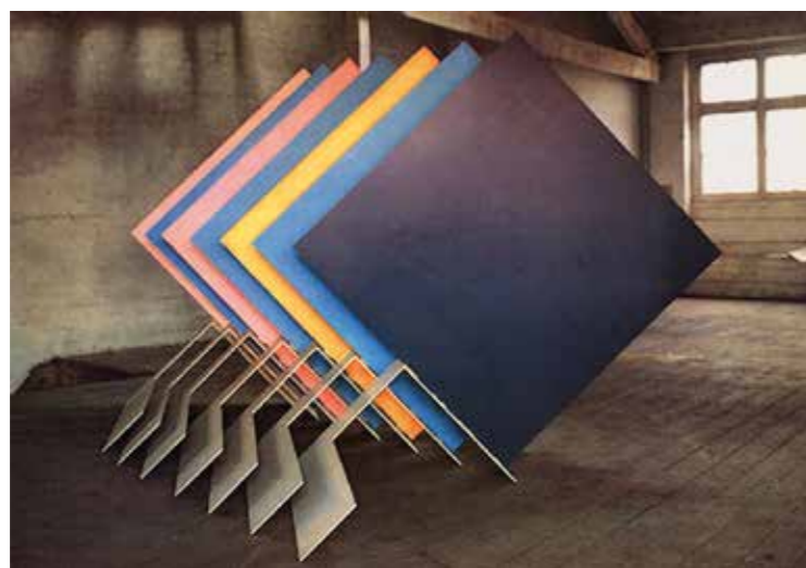
2. Michael Bolus: 1st Sculpture , 1969 magántulajdon