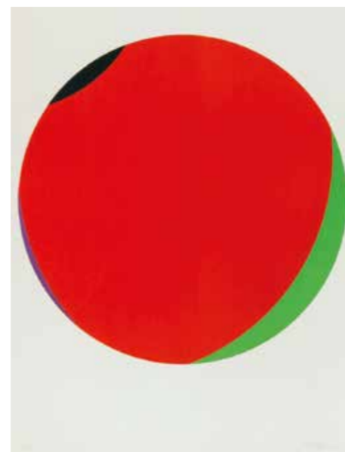
4. Alexander Liberman: Red Circle , 1976 Smithsonian American Art Museum. Gift of the Woodward Foundation.

Fajó János harminchárom évesen rendezhette meg első önálló kiállítását. A Krisztusi kor, mesterének, Kassák Lajosnak az 1967-es halála, valamint ezáltal a magyar avantgárd művészet egyik kulcsfontosságú pozíciójának megüresedése – egyaránt megerősítette Fajót abban, miszerint eljött az idő, hogy művei mellett tisztán és érthetően megfogalmazza és nyilvánosságra hozza saját „ars poeticáját” is. 1 Vallotta, hogy csak önmaga megváltásán keresztül, stabil világszemlélettel lehet továbbmenni, a közösséget felemelni. Hitte, hogy a legegyszerűbb geometriai formákkal, színekkel és a köztük lévő viszonyok variálásával az Egyetemesség leglényegibb jellemzőit lehet kifejezni. Szellemi „őseihez” (Kassák, Vasarely, Max Bill) hasonlóan egyféle totalitás, optikai teljességre törekvés jellemzi munkáit.