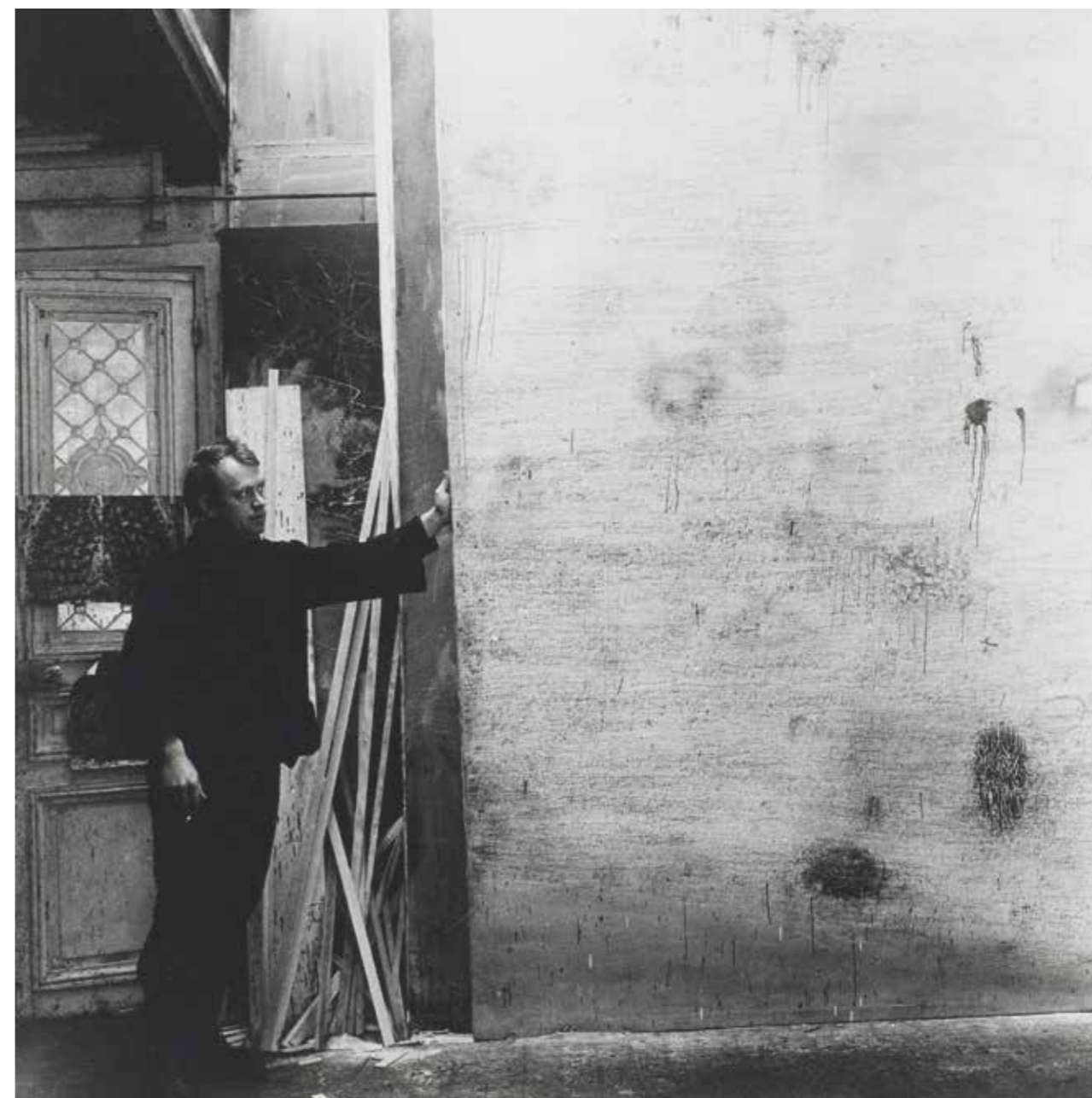
5. Simon Hantai az „Écriture Rose” című festménye előtt, 1958-59

„pszichoszexuális” tartam már nem a szellem (átvitt értelemben a szem) projekciója, hanem immáron testtapasztalat. Ezek eleinte heves gesztusok, az anyag és az ember találkozása, amelynek erotikus töltete van. Később, az évtized vége felé a felület „visszafogottabb kalligráfiává” csendesedik, ahogy látható a most aukcióra kerülő képünkön is. 3 Jól