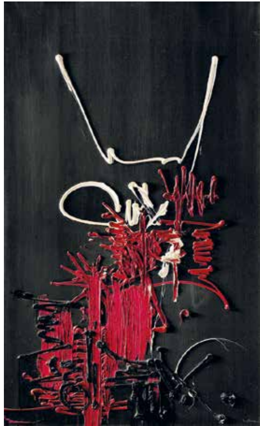
1. Georges Mathieu: Cybernetici , 1957 magántulajdon