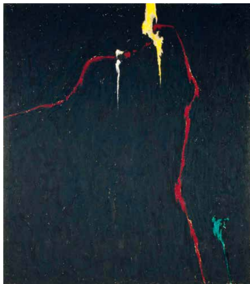
3. Clyfford Still: 1944-N No.1 (PH-235), 1944 Clyfford Still Museum

Bretonnal, mivel nem értenek egyet a modern művészet jövőjével kapcsolatban. Ennek egyik oka Jackson Pollock és az absztrakt expresszionizmus, amely az automatizmust egy új szintre emelte. Ugyanakkor a művekben a „váltás”, a figuralizmus, valamint a hagyományos festészeti eszközök végleges elhagyását kivéve, nem volt ilyen éles, hanem inkább fokozatos. A képek mérete megnőtt, a vásznak lekerültek a földre, a drága festéket felváltotta az olcsóbb ipari (a pengét pedig egy ébresztőóra fémkereke). Akárcsak az amerikai absztrakt expresszionistáknál. Hantai mozgalmas világa és a