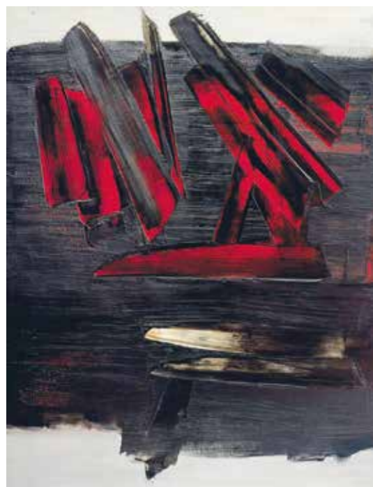
2. Pierre Soulages: Peinture , 1959 magántulajdon

Egy életen át tartó hűséges barátja, a költő Juhász Ferenc 2008-as Hantaï-nekrológiájában az alábbi sorokkal idézte fel a festő emlékét: „Volt, hogy Mein-ben hetekig beszélgettünk és vitakoztunk is: a szemcsöndön, a szemhalláson, a kicsúcsosodáson meg a begyűrődésen, az üresen és a telitetten, a fehér négyszögrácsokat betöltő kék, vagy sárga, vagy sváb-lila, vagy zöld, vagy kék négyzeteken, amelyek, mint az arabrácsok szünetei. Neki mindig a fehér volt a fontosabb. A befelé fordulás. A lángcsóvatömegek, fodorgyűrődések, szőrös és csipkés festékpikkely-levelek, az örvénygyűrűk alatti tiszta belső csönd. A fehér a fehéren, a fehér a fehérben. A fekete a feketében. Nem úgy, mint Soulages-nál, vastagon, irgalmatlanul, de szemcsönddel, szemhallással. Bár volt töprengő s a világot kifordítva látó lényében valami Leonardóhoz hasonlító