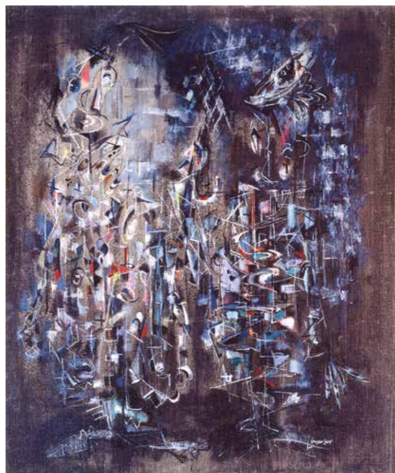
4. Norman Lewis: Cantata, 1948 Dayton Art Institute, Ohio, Egyesült Államok (Museum purchase with funds provided by the 1996 Associate Board Art Ball 1996.12)