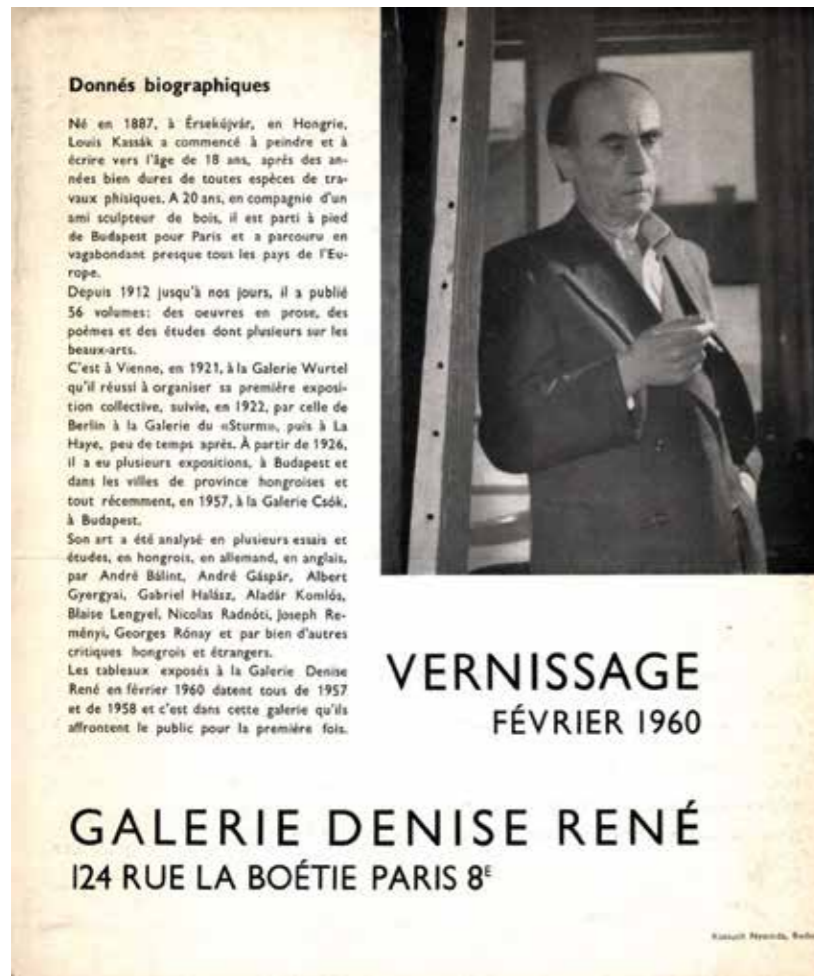
2. A Galerie Denise René kiállítási katalógusa, Párizs, 1960