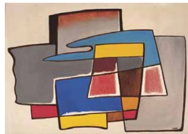
5. Kassák Lajos: Kompozíció, 1959 Kassák Múzeum, Budapest