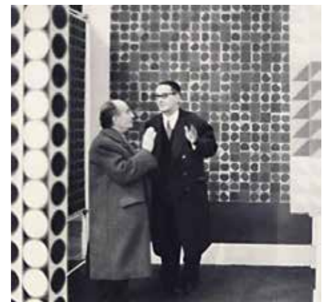
4. Victor Vasarely és Kassák Lajos Vasarely Musée des Arts Décoratifs-ban megrendezett kiállításán, Párizs, 1963