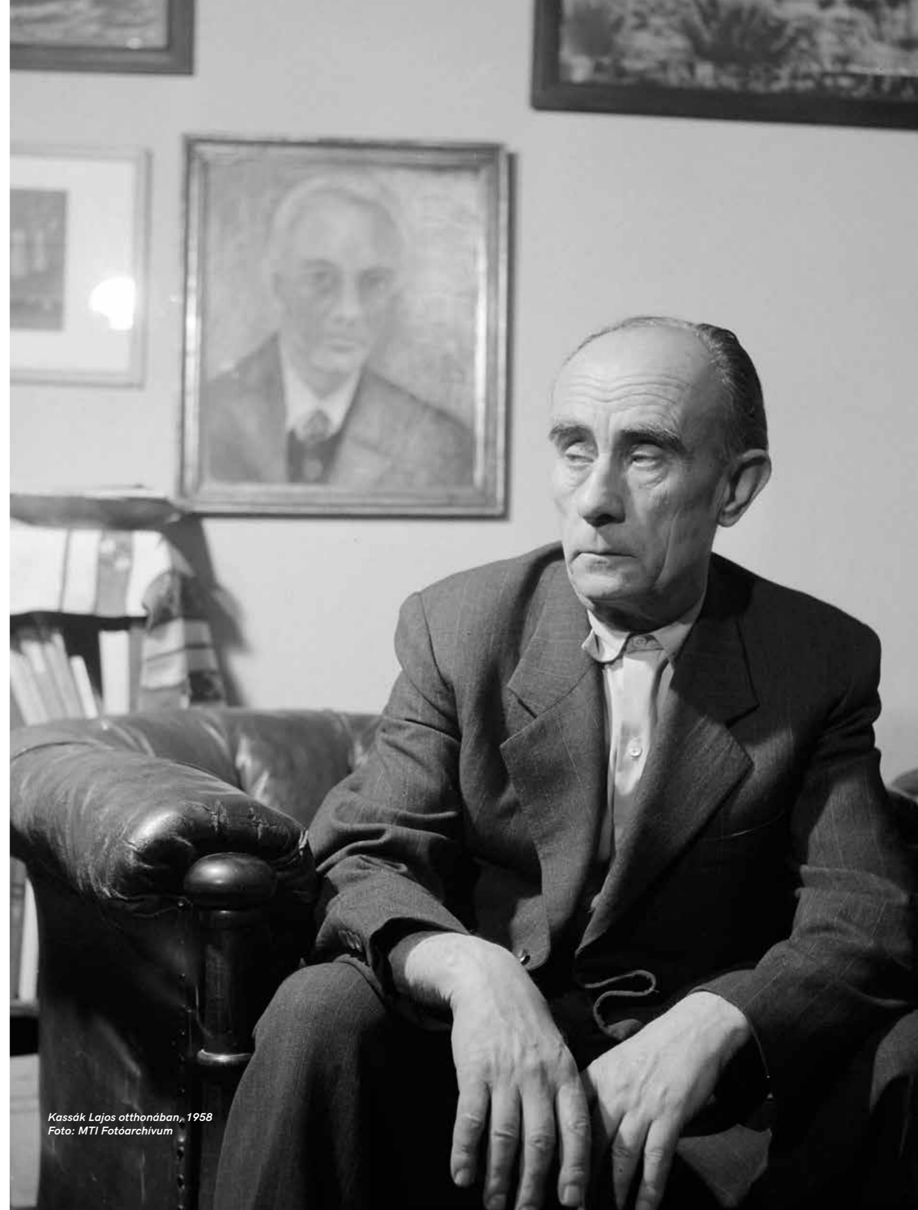
Kassák Lajos otthonában, 1958

„De művein ott vannak más vonások, olyanok, amelyek a magyar lírának és zenének is jellegzetességei, az indulatos dinamika, az intellektuális kompozíciót elfedő robusztus erő és színezőkészség, vagy az időnkénti darabosság. Színvilága zsúfolt atmoszférájú, az okkertől a barnák és vörösek árnyalatain át halad a feketéig, meleg tónusú zománcfénybe vonva a zöldeket és kékeket is.”